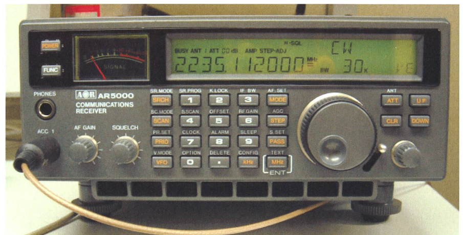
Fig. 2: Kommerzieller Empfänger zum Empfang der Raumsonde auf 2235.10000MHz. Der eingestellte Offset von 12KHz kompensiert die aktuelle Dopplerverschiebung auf Grund der hohen Geschwindigkeit von SMART-1.