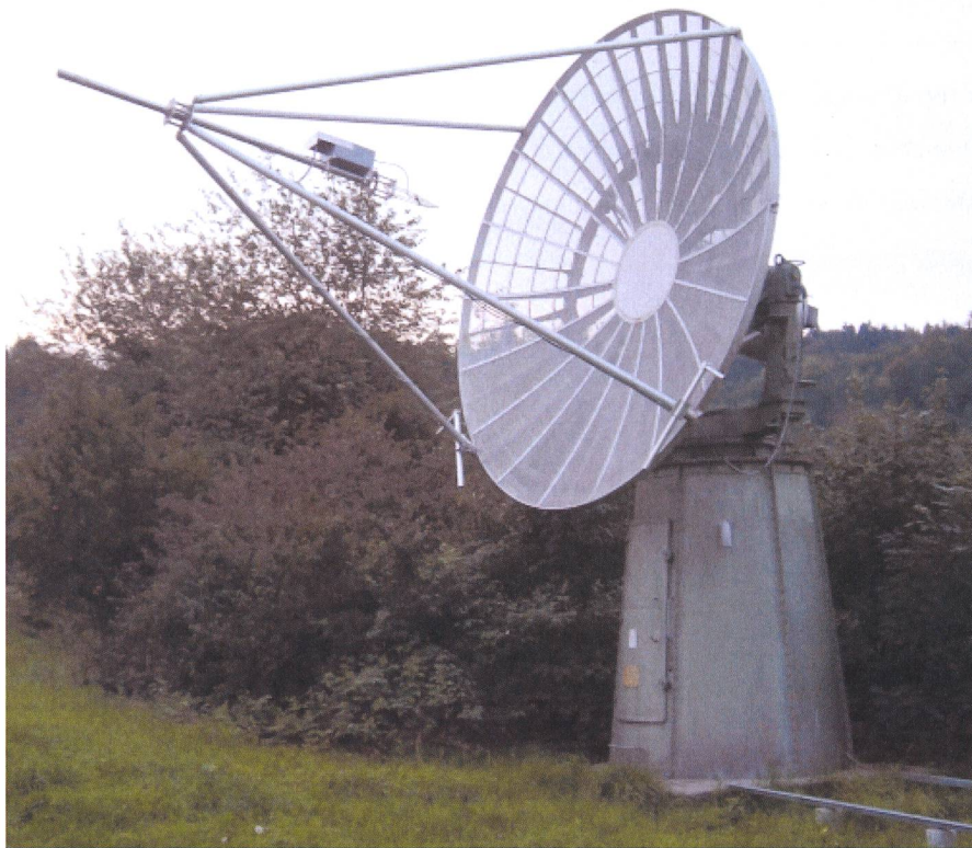
Fig. 1: 5m-Parabolspiegel automatisch positioniert auf den Mond mit sehr tiefer Elevation am Abend des 2. September 2006.

Das Hauptziel dieser ESA-Mission war es, einen neuartigen, solarelektrisch betriebenen Ionenantrieb und neue Navigations- und Kommunikationstechniken zu testen. SMART-1 war die zweite Sonde, welche diese Art von Antrieb verwendete (die erste war die amerikanische Sonde Deep Space 1). Nachdem SMART-1 auf eine Umlaufbahn um den Mond eingeschwenkt war, untersuchte diese ab Mitte November 2004 bis zum geplanten Impakt Anfang September 2006 die chemische Zusammensetzung der Mondoberfläche und suchte nach Wasser in Form von Eis. Ausserdem erhofft sich die Wissen-