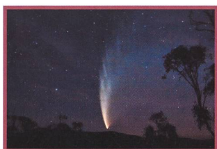
Les Potins d'Uranie Les Pompiers de Seattle - 29