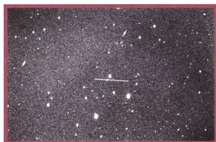
Das Schauspiel von 2007BD - 24