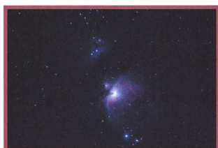
HDRI und «Tone-Mapping» - 19