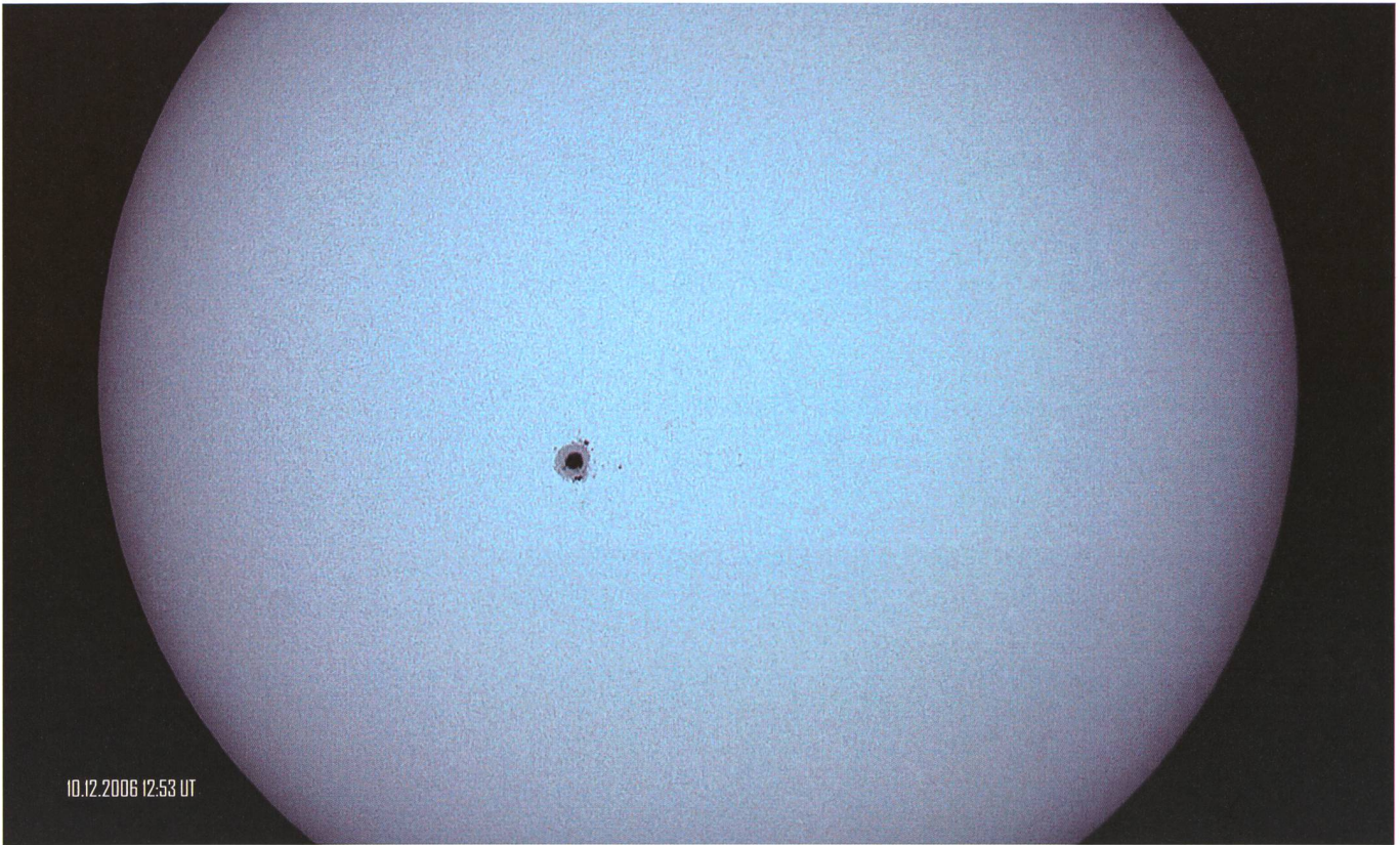
Abb. 2: Sonnenphotosphäre aufgenommen am 10. Dezember 2006 um 12:53 UT auf dem Uechter Sonnenturm in Niedermuhlern mit einer Canon EOS 300D Digitalkamera an einem Meade LX200 GPS Schmidt-Cassegrain Refraktor. Lichtdämpfung mit Baader Astro-Solar Sonnenfilterfolie. Belichtungszeit 1/200 sec. Bildbearbeitung in MaxIm DL.

Fotografia scattata il giorno 11 dicembre 2006 alle 08:05 da Roncapiano (Ticino) dall'amico Patricio Calderari. Si tratta del Sole all'alba con una magnifica macchia al centro. Telescopio: lichtenknecker optics a.g. 11 cm, f/15 al fuoco diretto. Apparecchio fotografico digitale: Canon EOS 20DA. Esposizione: 1/200 sec. Sensibilitr': ISO-100. Filtro: nessuno