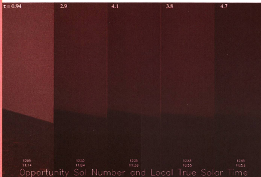
NASA's Opportunity erlebt derzeit seine dunkelsten Tage und Wochen. Die obige Bildsequenz zeigt Aufnahmen, welche an verschiedenen Marstagen, immer etwa zur selben Zeit aufgenommen wurden. Die Verdunkelung durch den feinen Marsstaub ist markant.

Wissenschaftler und Astronomen befürchten, dass die Stürme noch Wochen andauern könnten. Dann kämen die «Spirit» und «Opportunity» an ihre Leistungsgrenzen. Sie könnten nicht mehr ausreichend Strom generieren, um die Innentemperatur aufrecht zu erhalten. Auf Mars herrschen immerhin Temperaturen von -55^{\circ}\text{C} .