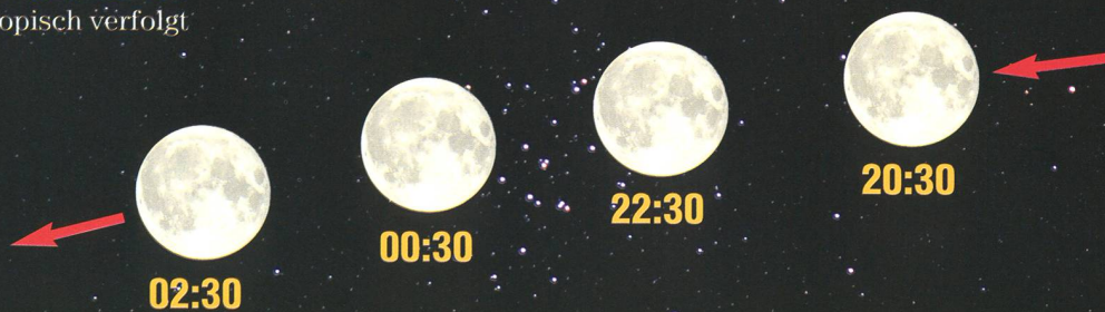
Die Bedeckung der Krippe durch den vollen Mond am späten Abend des 22. Januar 2008 wird man nur mittels Teleskop beobachten können.