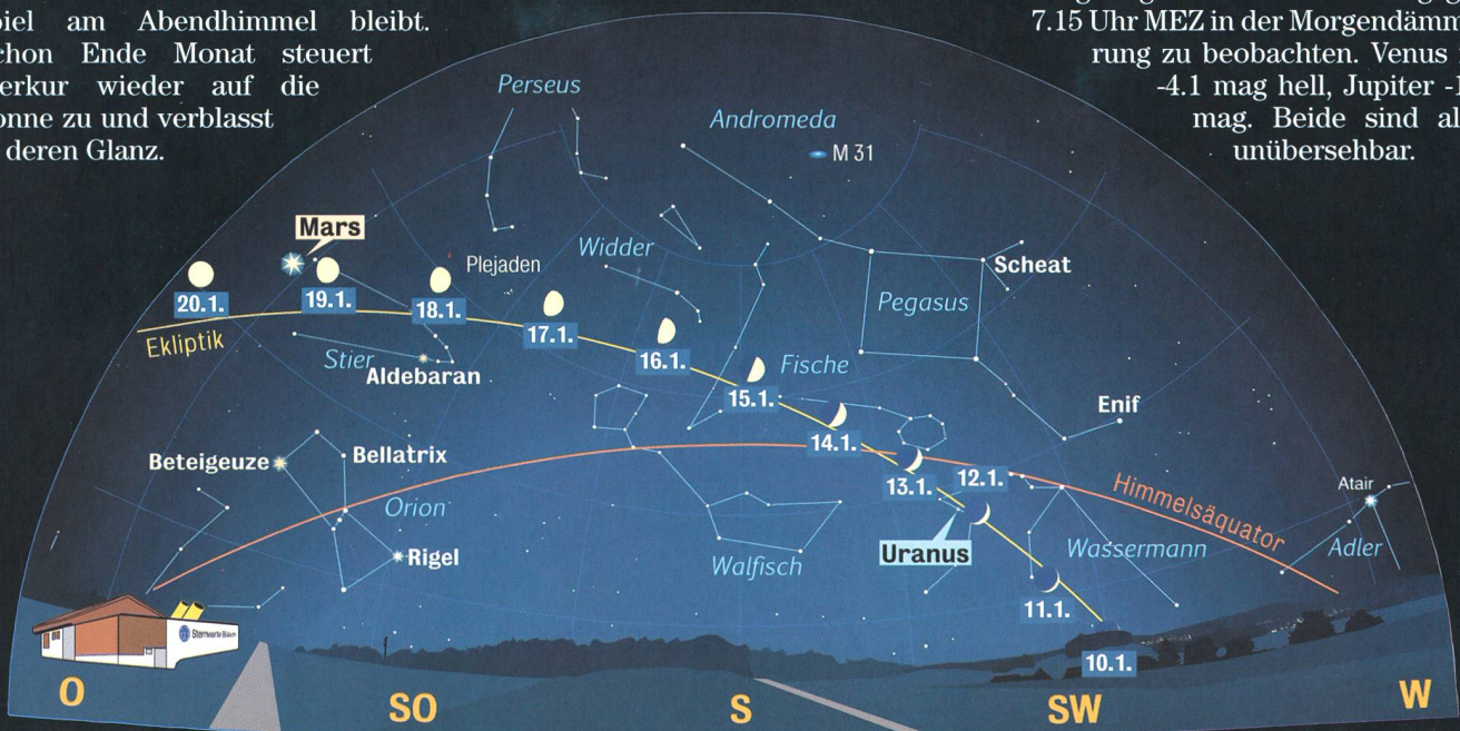
Anblick des abendlichen Sternenhimmels Mitte Januar 2008 gegen 18.15 Uhr MEZ (Standort: Sternwarte Bülach)

tenduo wird am 1. Februar um 14 Uhr MEZ erreicht. Dann zieht Venus nur 35' nördlich am Gasriesen vorbei. Die Annäherung ist aber bereits einige Tage vorher und nachher gegen 7.15 Uhr MEZ in der Morgendämmerung zu beobachten. Venus ist -4.1 mag hell, Jupiter -1.9 mag. Beide sind also unübersehbar.