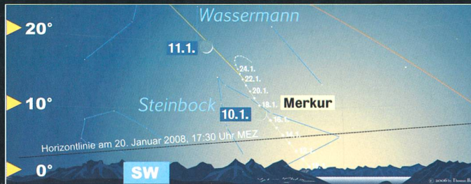
Vom 13. bis 30. Januar 2008 bietet uns der flinke Merkur eine respektable Abendsichtbarkeit. (Grafik: T. Baer)

Merkur ist oft schwierig zu beobachten, da er die Sonne relativ nah in nur 88 Tagen umrundet. Nur wenige Male bietet sich pro Jahr die Gelegenheit, nach dem sonnen-nächsten Planeten Ausschau zu halten. Meist ist dies im Frühjahr in der Abenddämmerung und im Herbst am Morgenhimmel der Fall, wenn die Ekliptik (scheinbare Sonnenbahn), entlang deren sich die Planeten bewegen, steil zum Horizont verläuft. Ein erstes Mal taucht Merkur ab Mitte Januar abends in Erscheinung, doch am besten sind die Beobachtungsbedingungen um den 22. Januar herum. Dann steht Merkur 19° östlich der Sonne und ist -0.5 mag hell gegen 17.45 Uhr MEZ ziemlich genau über dem Südwesthorizont zu sehen. Seine Helligkeit nimmt aber recht rasch wieder ab, so dass es bei einem kurzen Gastspiel am Abendhimmel bleibt. Schon Ende Monat steuert Merkur wieder auf die Sonne zu und verblasst in deren Glanz.