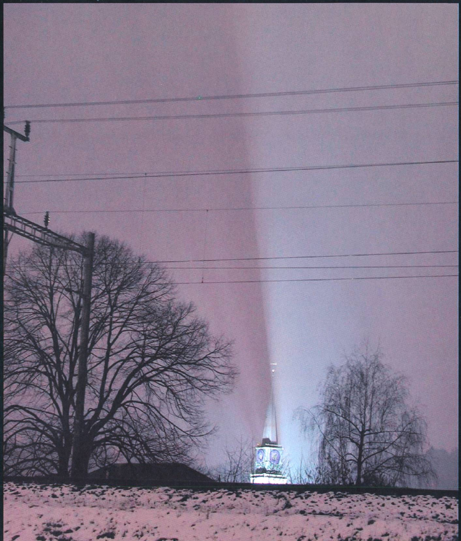
Bald in dezentem Schein; die Bülacher Kirche.

Uhr seinen Zauber entfaltet. Zwar wolle man mit diesem Projekt der im Tourismusort Flims unkontrolliert und stetig wachsenden «Lichtverschmutzung» zielgerichtet und auf Basis von Selbsterkenntnis Gegensteuer bieten, heisst es weiter. Während man im Wintersportort von einer Tourismusattraktion spricht und die neuartige saisonale Lichtkunst, da sie in den Medien, bei Einheimischen und Gästen viel Gefallen finde, schönredet, scheint die Aufklärungsarbeit der beiden Fachmänner Righetti und Liechi in Bülach erste Früchte zu tragen. Nachdem in der Broschüre «Empfehlungen zur Vermeidung von Lichtemissionen» des Bafu die re-