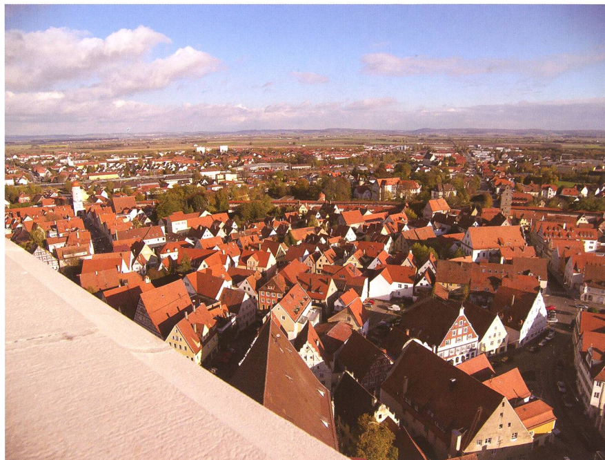
^ Vom 90 Meter hohen Turm der St. Georgskirche in Nördlingen (von den Einheimischen Daniel genannt) ist bei gutem Wetter ringsum der äussere Rand des Rieskraters als Horizontbegrenzung zu sehen.

Insgesamt wurden rund 150 Kubikmeter Gestein ausgeworfen und es blieb eine rund 500 Meter tiefe Einschlagnarbe zurück. Als die wichtigsten Auswurfgesteine gelten einerseits die Bunte Breccie und andererseits der Suevit, der im Mittelal-