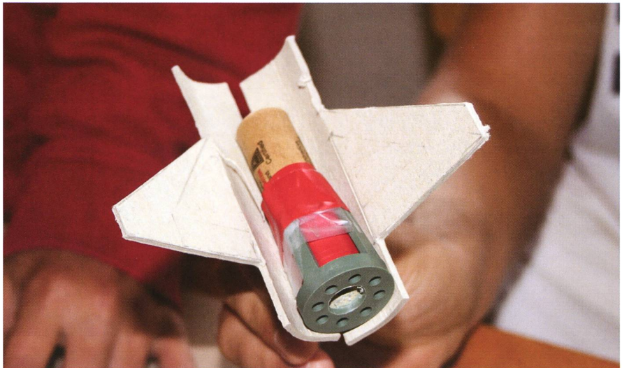
^ Ob der Raketenantrieb auch wirklich funktioniert?

Ist die Überalterung eines Vereins einmal eingetreten, wird die Nachwuchsförderung aufgrund der oben beschriebenen Punkte zu einer