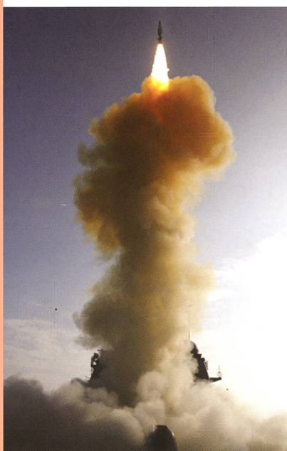
Von der USS Lake Erie startet eine Rakete zur Zerstörung von USA 193.

Am Donnerstagsmorgen, 21. Februar 2008 mitteleuropäischer Zeit feuerte ein Zerstörer der U.S. Navy, die USS Lake Erie, eine taktische Rakete gegen den Satelliten USA 193. Dieser wurde mit einer Relativgeschwindigkeit von nahezu 10 Kilometer pro Sekunde 247 Kilometer über dem Pazifik bei Hawaii getroffen. In den