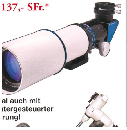
Optional auch mit Computer-gesteuerter Nachführung!