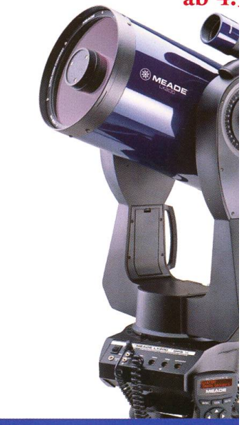
MEADE LX200ACF Der High-End Allround