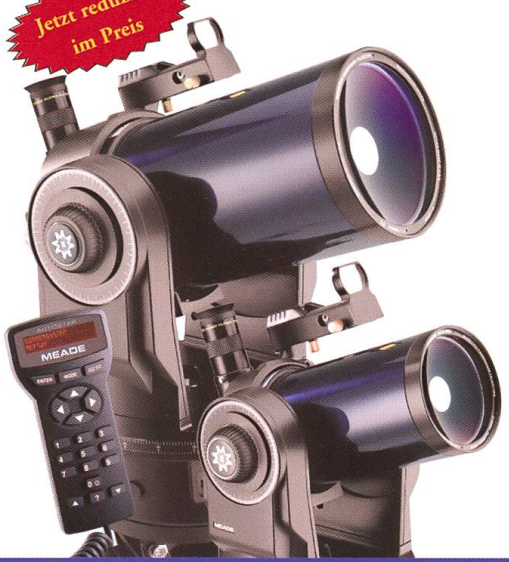
MEADE ETX 90 / 125 Spitzenleistung auch für die Reise