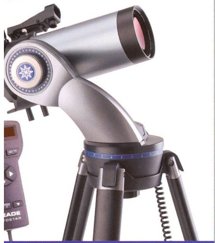
MEADE DS-2090MAK / DS-2102MAK Der perfekte Einstieg