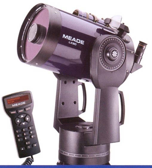
MEADE LX90ACF 8" & 10" Günstigste Flatfield Optik!