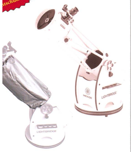
MEADE LIGHTBRIDGE 8" 10" 12" 16" Astronomie Pur