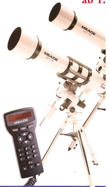
MEADE LX75 - 5" Das Universalteleskop