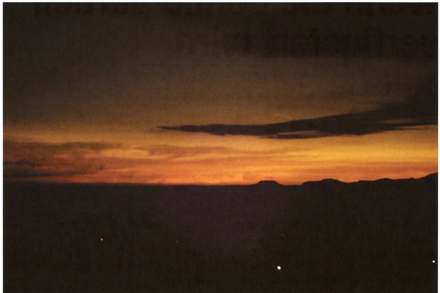
Figur 2: Am 11. Juli 1991 fand über Baja California mit einer Totalitätsdauer von fast 7 Minuten eine ausgesprochen lange Sonnenfinsternis statt. Die beiden Fotos entstanden vor und während der totalen Phase und zeigen, wie stark die Landschaft abgedunkelt wurde..

können aber nur bei einer totalen Sonnenfinsternis ohne spezielle Vorrichtungen gesehen werden.