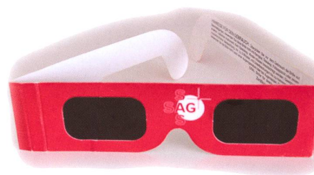
Figur 4: Sichere Beobachtung mit einer Black Polymer- Sonnenfinsternisbrille.

Ganz generell gilt bei der Sonnenbeobachtung, das Licht dort zu filtern, wo es in eine Optik eindringt. Was man niemals machen darf, ist mit einem Fernglas oder Teleskop direkt in die Sonne schauen. Das stark gebündelte, gleissend helle Sonnenlicht würde innert Sekunden die Netzhaut verbrennen. Irreparable Augenschäden wären die Folge. Eine andere Methode ist, wenn man die Sonne auf ein weisses Papier