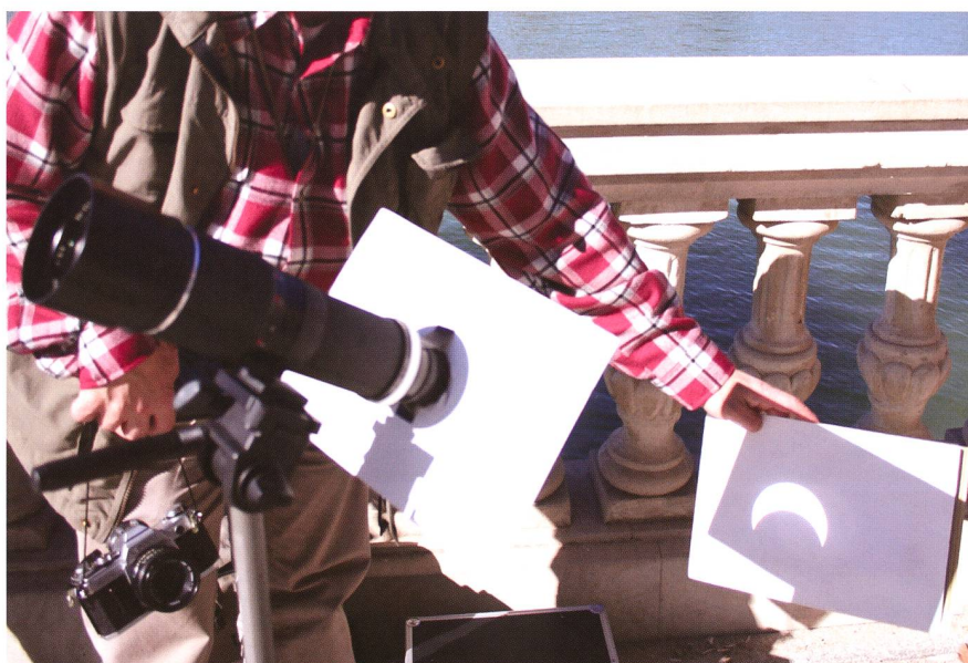
Figur 3: Die Projektionsmethode ist nach wie vor eine sichere Variante, eine partielle Sonnenfinsternis gefahrlos zu beobachten.

recht einfach selber basteln (vgl. Seite 17). Bestellt werden kann diese Folie zum Beispiel bei Foto Wyss (siehe Inserat auf der ORION-Rückseite).