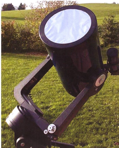
Figur 6: Sichere Sonnenbeobachtung: Dieses Teleskop wurde mit einem Mylar-Sonnenfilter bestückt.

sche Filme, Röntgenbilder etc. dämpfen zwar das sichtbare Licht sehr effektiv, jedoch lassen sie die für das Auge schädliche Infrarot- und UV-Strahlung nahezu ungehindert passieren.