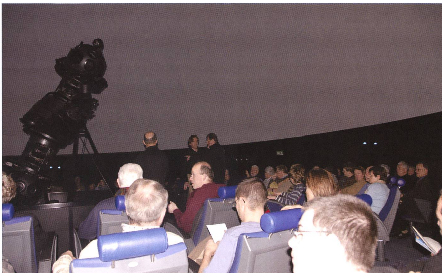
Gespanntes Warten auf den Beginn der Vorführung.