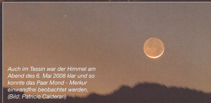
Auch im Tessin war der Himmel am Abend des 6. Mai 2008 klar und so konnte das Paar Mond - Merkur einwandfrei beobachtet werden.

Eine seltene Konstellation bot sich am Abend des 6. Mai 2008, als der flinke Merkur Besuch erhielt von der schmalen Mondsichel. Die Abend-sichtbarkeit von Merkur in der ersten Maihälfte dieses Jahres dürfte seit langem eine der besten gewesen sein. Das klare Wetter begünstigte das hübsche Gruppenfoto. Die Wald-silhouette unten auf der rechten Bildhälfte ist der Sonnenberg bei Luzern. Beim hell beleuchteten Objekt unten links handelt es sich um das Schlösschen bei Kriens. Und dies ist den in den Augen eines Astronomen das «weinende Auge», nämlich die nächtliche Scheinwerfer-Beleuchtung von unten nach oben. Lichtverschmutzung lässt grüssen.