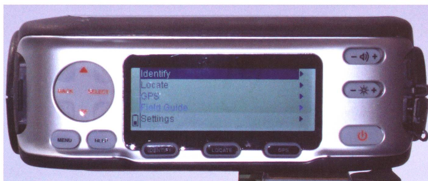
Dans cet article le Skyscout est monté sur une rotule et un trépied photo. Le SkyScout dispose d'un pas de vis "kodak" à cet effet.

Des composants électroniques sont apparus récemment pour mesurer les accélérations. Ces accéléromètres sont utilisés par exemple dans les airbags de voiture. La puce électronique dispose de quelques millièmes de seconde pour déterminer si la décélération brutale qu'elle mesure provient d'une collision, d'un freinage énergétique ou d'un passage