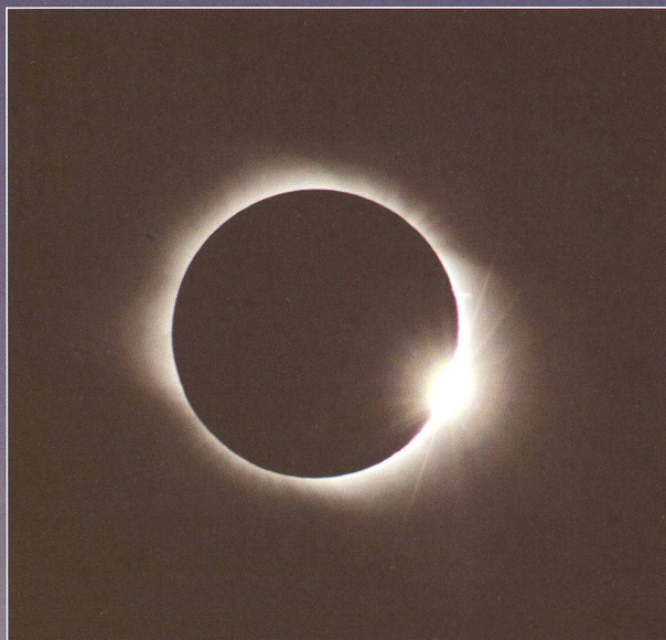
Nach 1 Minute und 50 Sekunden ist der Spuk vorbei. Der erste Sonnenstrahl bricht am Mondrand durch, die Minimumskorona verblasst und die einzigartige Dämmerung wandert mit 6 Mach in Richtung Osten.

Wer einmal eine totale Sonnenfinsternis bei klarem Himmel beobachten konnte, kann verstehen, dass dieses Himmelsphänomen süchtig macht. Nach meiner ersten Finsternis 1999 im Regen, war für mich das Schlüssel-erlebnis 2001 in Sambia, als wir bei absolut klarem Himmel mitten im Busch die Totalität erleben durften. Seit dieser Zeit gehöre ich zu den Finsternisjägern und bin «süchtig» nach den Minuten unter der schwarzen Sonne.