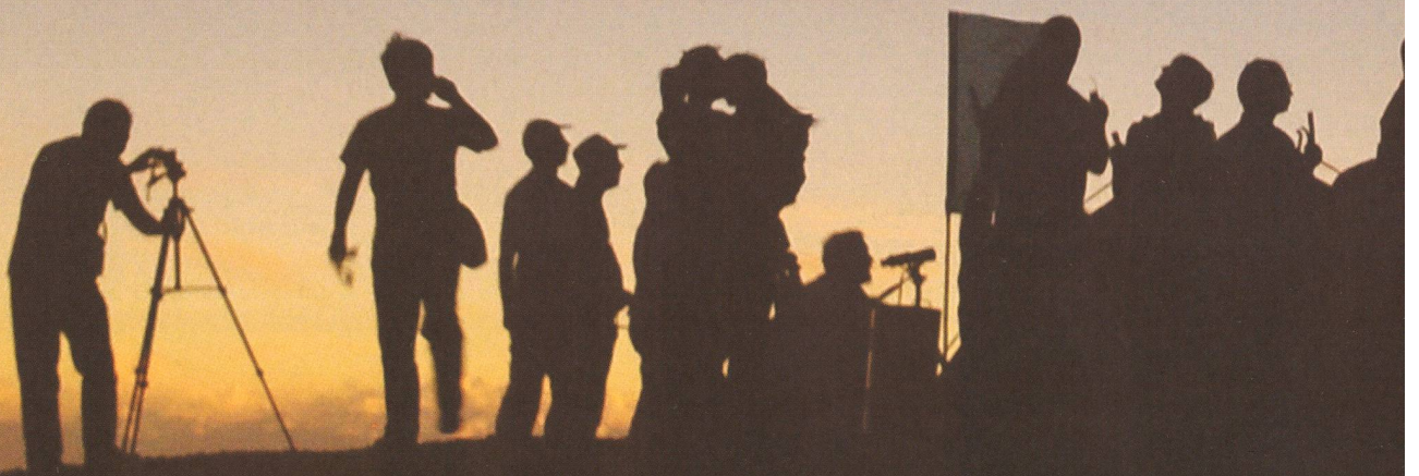
Das Hintergrundbild zeigt die Expeditionsgruppe aus der Schweiz als Silhouette im Kernschatten des Mondes. Am Horizont leuchtet die Erdatmosphäre im Licht der partiellen Sonnenfinsternis.

senden. Zum Gaudi der anwesenden «Ausländer» stimmten wir Schweizer unsere Nationalhymne an. Die Sonne ging kurz nach dem 4. Kontakt unter und eine wunderbare Nacht legte sich über die Wüste Gobi. Auf der Rückfahrt mit dem Bus nach Jiayuguan konnten wir durch die Fensterscheiben die Sommermilchstrasse inklusive einiger Sternhaufen, den ganzen Skorpion und den Schützen von blossem Auge beobachten. Es war mal etwas Neues, den Leuten eine Sternwartenführung aus dem Bus zu präsentie-