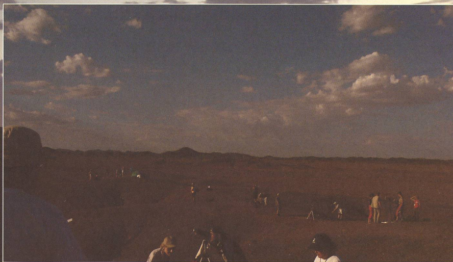
Wie dunkel es im Laufe der zunehmenden partiellen Sonnenfinsternis wurde, veranschaulichen die beiden Vergleichsfotos. Auf dem oberen Bild ist von der Finsternis in der Natur noch nichts zu sehen.