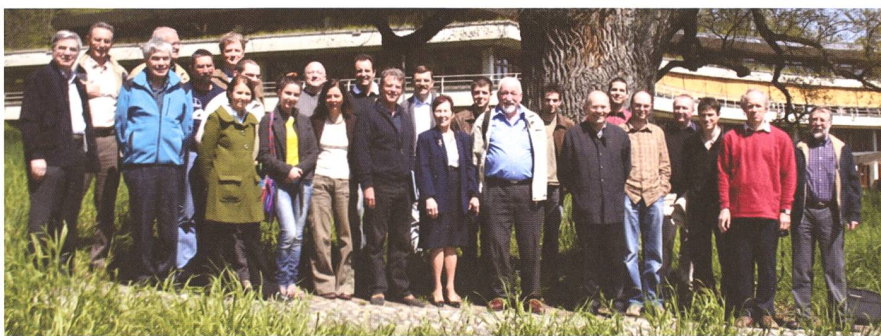
Les participants à la réunion IYA2009 en Suisse Romande du 26 avril 2008

la première fois les phases de la planète Vénus, similaires aux phases de la Lune. Une année seulement s'est écoulée depuis ses premières observations astronomiques... Une telle suite de découvertes, remettant toutes en question les idées (ou les a priori) sur les objets étudiés - Lune, Voie Lactée, Saturne, Soleil, Vénus -, et au-delà sur la conception du monde, n'a pas d'équivalent dans toute l'histoire des sciences. Si on ajoute que GALILÉE a en plus publié ses découvertes dans le Sidereus Nuncius (Le Messager des Étoiles) en mars 1610, et qu'il a démenagé de Venise à Florence en juillet, on peut penser qu'il a connu une année pleine !