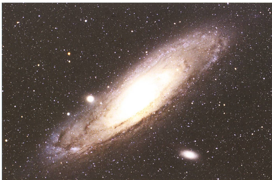
Abb. 8: M 31, 215 min belichtet mit Canon 20Da und Pentax 105 SDHF bei f/4.8.

Weitere Informationen: www.teleskoptreffen.ch