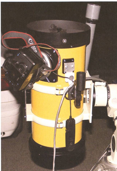
Abbildung 5: Takahashi Epsilon 180ED f/2.8 Astrograph.

sierte Gerät mit hyperbolischem Hauptspiegel von 18 cm Durchmesser, elliptischem Fangspiegel, zweilinsigem Korrektor aus ED Glas sowie rotierbarem Auszug bildet die Sterne bis in die Ecken des Kleinbildformats (24x36 mm) scharf ab. Die hohe Lichtstärke dieses Instruments erlaubt auch mit normalen digitalen Spiegelreflexkameras sehr gut durchbelichtete Aufnahmen bei relativ moderaten Belichtungszeiten und stellt deshalb für jeden ernsthaften Astrofotografen eine interessante Option im Brennweitenbereich um die 500 mm dar (vgl. Abb. 5).