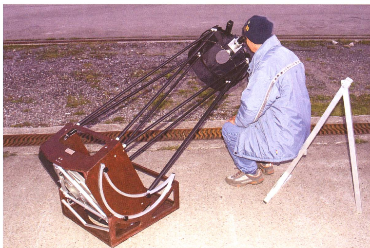
Abbildung 3: 46 cm f/4.2 Lowrider Reisedobson, der bloss 21 Kilogramm wiegt.

warten war, liess auch die Abbildungsqualität dieses Lowriders keine Wünsche offen. Der Zentralstern im Ringnebel war damit beispielsweise leicht zu sehen, was neben einer grossen Lichtleistung eine kontrastreiche Optik voraussetzt. Neben dem 60 cm Lowrider vermochte ein weiterer, mit 46 cm Durchmesser etwas kleinerer Lowrider-Eigenbau die Bewunderung vieler Beobachter zu wecken. Dieses für Flugreisen konzipierte f/4.2 Gerät von TIMM KLOSE wiegt dank ultraleichtem Hauptspiegel und konsequenter Leichtbausweise aus Holz, Karbon, Stahl und Aluminium erstaunlich geringe 21 Kilogramm und sieht darüber hinaus auch noch