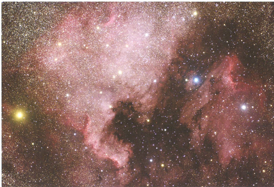
Abbildung 5: Takahashi Epsilon 180ED f/2.8 Astrograph.

Instrument gehört mit seinem korrigierten Bildkreis von 88 mm Durchmesser (dank fest eingebauter Bildfeldebnungslinse) sicherlich zu den besten derzeit käuflichen fotovisuellen Teleskopen im Brennweitenbereich zwischen 500 und 1000 mm (vgl. Abb. 6).