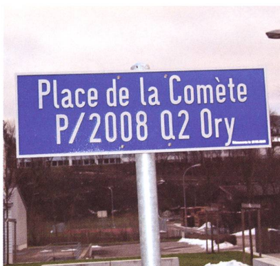
Le vendredi 12 décembre 2008, la Commune de Vicques (Jura) a inauguré une nouvelle place au centre du village. Une place qui marque à jamais la découverte exceptionnelle d'une comète périodique sur les hauteurs de la petite localité.

Les nombreux astéroïdes que j'ai découverts depuis 2001 à l'Observatoire astronomique jurassien de Vicques (1) ressemblent à de gros