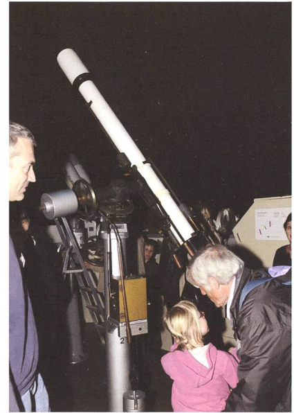
Blick nach oben.

Um Mitternacht beendeten wir unsere Aktivitäten und die Helferinnen und Helfer mit Schwerpunkt Abbau machten sich ans Werk. Zu erwähnen ist, dass viele von ihnen schon beim Aufbau geholfen haben, dementsprechend mussten die Kräfte nochmals mobilisiert werden. Aber der grosse Erfolg dieses Tages, das Interesse des Publikums und der