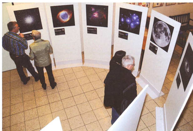
Fantastisch aufbereitet, fesseln die spektakulären Astronomie-Aufnahmen der Wanderausstellung die Besucherinnen und Besucher.

Fernrohrs von GALILEO GALILEI und des Hubble Space Teleskopes liessen die Besucherinnen und Besucher bereits beim Betreten des Schulhauses in die Welt der Sternkunde eintauchen. Die Gäste liessen dann auch nicht lange auf sich warten. Von 16 Uhr bis Mitternacht bevölkerten zwischen 400 und 500 Personen das