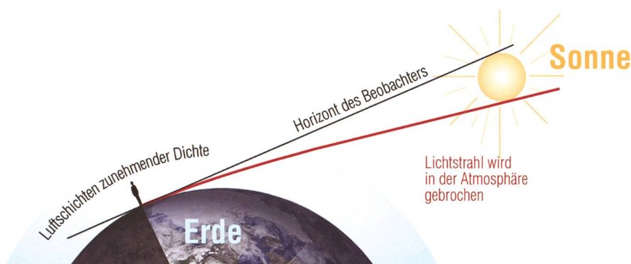
Abb. 1: Durch die zunehmende Dichte der Erdatmosphäre gegen die Oberfläche hin, wird ein Sonnenstrahl gebrochen. Steht die Sonne geometrisch betrachtet bereits unter dem Horizont, können wir sie infolge der Refraktion in der Tat noch etwas länger sehen. (Grafik: Thomas Baer)

Radioastronomen haben es gut: sie müssen zum Beobachten nicht warten, bis es endlich dunkel wird. Wir Amateure können allenfalls noch Venus und Merkur (und natürlich die Sonne) tagsüber beobachten, für alle andern Objekte sind wir auf mehr oder weniger tiefe Dunkelheit angewiesen.