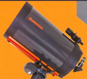
CGE Pro 1400