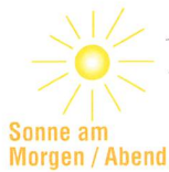
Abb. 3: Eigentlich hätten unsere Vorfahren merken müssen, dass eine scheibenförmige Erde nur um Mitternacht einen kreisrunden Schatten in den Raum werfen könnte. Kurz vor Sonnenauf- und nach Sonnenuntergang hätte dieser aber eine elliptische Form. (Grafik: Thomas Baer)