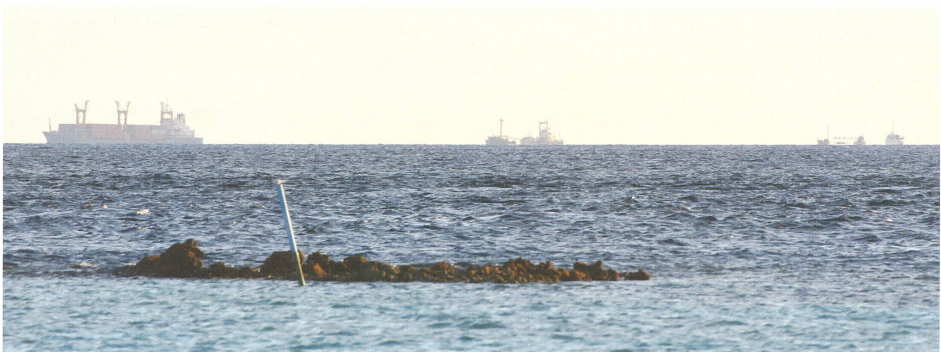
Abb. 2: Tatsächlich, sie ist rund, die Erde! Hier tauchen gleich drei Frachtschiffe hinter dem Horizont auf. Sie steuern den Hafen von Malé auf den Malediven an.