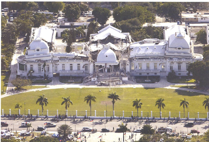
Der nach dem Erdbeben vom 12. Januar 2010 eingestürzte Präsidentenpalast in Port-au-Prince. Neumond war nur 2½ Tage später.

Observatory & Planetarium Stuttgart Mittlerer Schlossgarten D-70173 Stuttgart