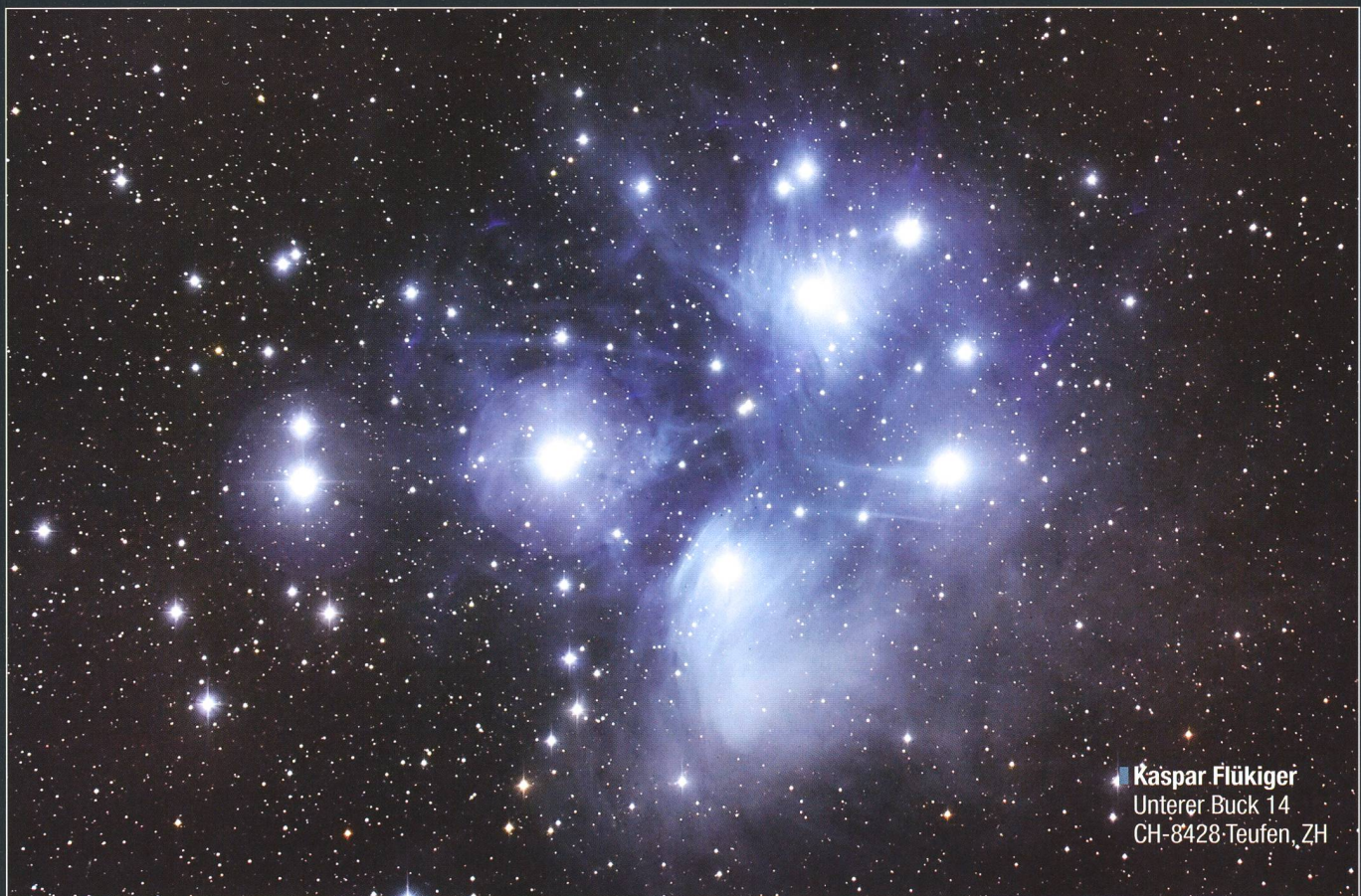
■ Kaspar Flükiger Unterer Buck 14 CH-8428 Teufen, ZH