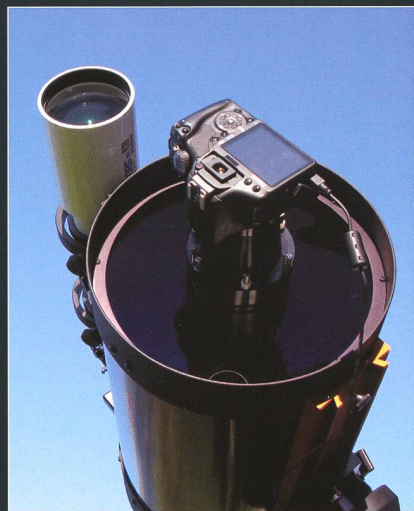
Das C11 bildet zusammen mit der HyperStar-Optik und einer digitalen Kamera eine Astroausrüstung der Superlative.

Fotografie. Um in den Genuss der Live View-Funktion zu kommen, habe ich meine Canon EOS 20D durch eine kleinere, selber modifizierte EOS 450D ersetzt. Das Anbringen der HyperStar-Optik ist sehr einfach, verlangt aber sorgfältiges Hantieren unmittelbar vor dem Teleskop. Der entfernte Fangspiegel wird im mitgelieferten Behälter sicher aufbewahrt. Das ganze System lässt sich kollimieren, was bei meinem Teleskop nicht notwendig war. Besondere Aufmerksamkeit ist der Scharfstellung zu schenken. Diese ist bekanntlich bei einem lichtstarken Instrument wegen der geringen Schärfentiefe wesentlich anspruchsvoller als bei einer lichtschwachen Optik. Eine willkommene Unterstützung ist die Live View-Funktion der Kamera. In den meisten Fällen zeigt das Live View-Bild, dank der Lichtstärke der Optik, bereits in dem für die Aufnahme gewählten Bildausschnitt einen Stern, der sich für die Fokussierung eignet. Ein kurzes Zentrieren auf diesen Stern zum Fokussieren genügt. Als Erleichterung hat sich der Einbau eines „Micro Focuser“ von Starizona bewährt. Zur automatischen Nachführung wird im Re-