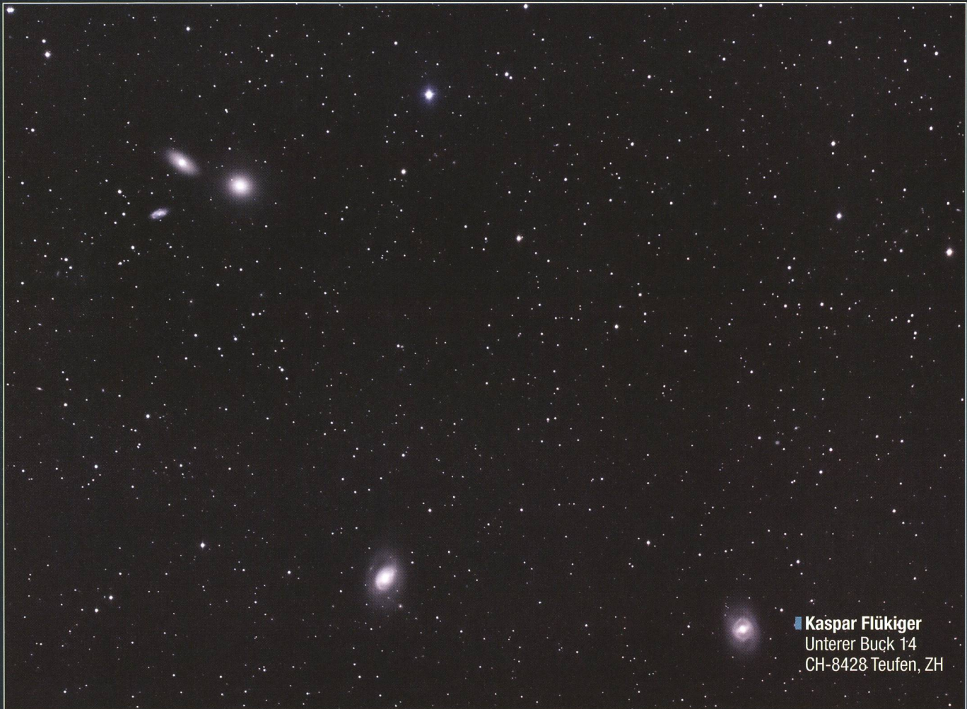
■ Kaspar Flükiger Unterer Buck 14 CH-8428 Teufen, ZH