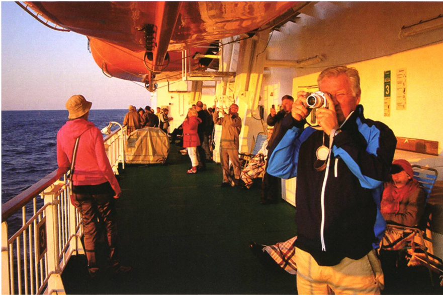
Figur 4: Schiffspassagiere beim Fotografieren der Mitternachtssonne am 23. Juli 2009 auf 71° nördl. Breite.

kreise: die Arktis im Norden und die Antarktis im Süden. Hier herrschen Temperaturen von bis zu minus 70 Grad Celsius, und wohin man nur schaut: baum- und strauchlose Tundra, Schnee-, Eis- oder Geröllwüste.»