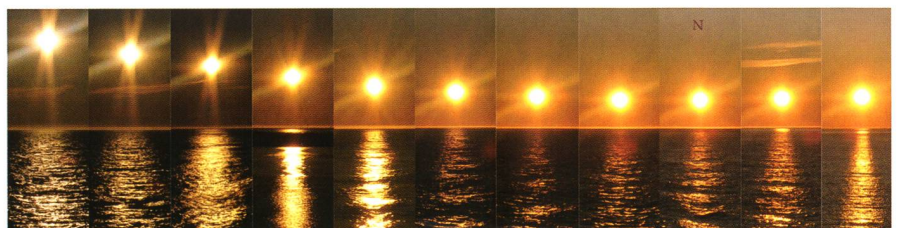
Figur 3: Panorama der Mitternachtssonne am 22. / 23. Juli 2009. Aufnahmeorte variabel von 29°31' E / 70°48' N um 21:30 MESZ bis 27°51' E / 71°03' N um 00:50 MESZ. Nördlichster Punkt der Reise auf 71° 06'53,6" am 23.7.2009 um 00:16 MESZ.

Mit Hilfe des Astro-Simulationsprogramms «Voyager» habe ich auf Grund der GPS-Daten für jede Aufnahme ermittelt, in welcher Höhe und Richtung (Azimut) die Sonne stand. Erste erfreuliche Ergebnisse: Die Sonne stand tatsächlich um 00:10 Uhr am tiefsten (in 1°12' Höhe) und mit Azimut 359°10' recht genau im Norden. 20 Minuten vor und nach diesem Zeitpunkt betrug die Sonnenhöhe 1°14', bei Beginn der Fotoserie 4°. Die Differenz der Sonnen-Azimute von einer Aufnahme zur nächsten schwankt zwischen 4,41° und 4,65°. Ich verwende für die weitere Auswertung einen Durchschnittswert von 4,5°. Mit Hilfe von Testaufnahmen habe ich ermittelt, dass die Längsseite meiner Tele-Aufnahmen einen Winkel von 9,8° erfasst.