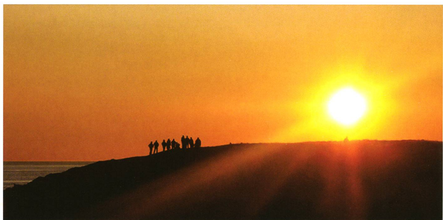
Figur 5: Mehamn auf 71°03' nördl. Breite ist der nördlichste Hafen auf der Hurtigruten-Reise. Hier fand eine «nächtliche» Tanz-Party statt. Die Menschen stiegen auf den nahen Hügel und genossen die Sonne um Mitternacht.

Das Schiff befindet sich somit noch 9 Winkelminuten südlicher, also auf 65°35' nördl. Breite, 110 km vom Polarkreis entfernt.