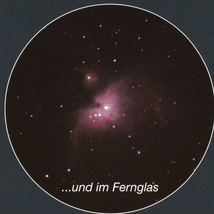
...und im Fernglas

Schon den Arabern muss diese Region aufgefallen sein, denn sie nannten sie