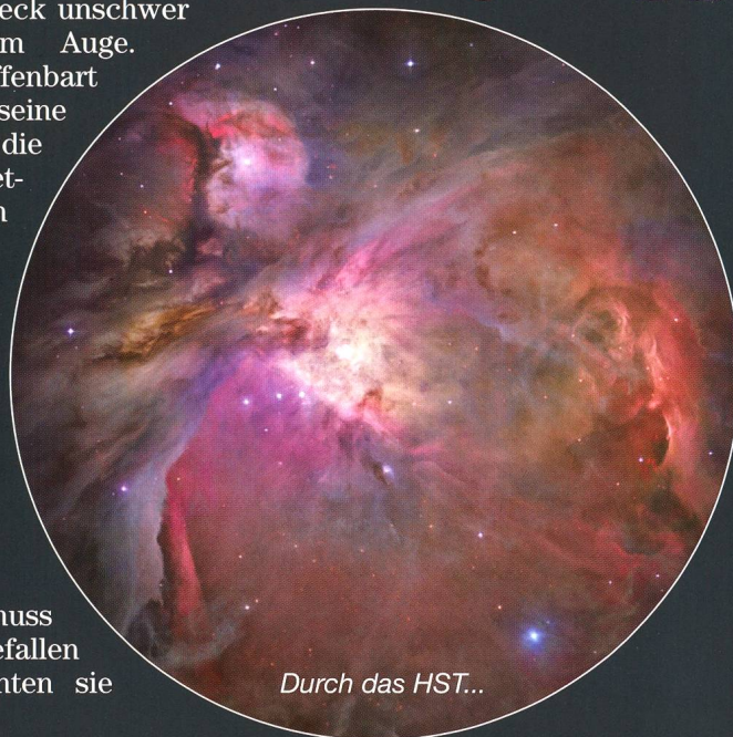
Durch das HST...