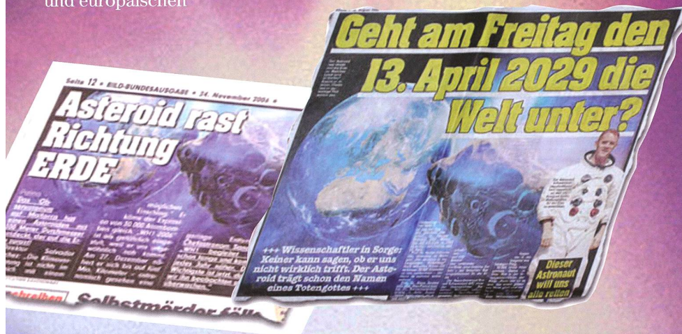
Abb. 2: Solche und ähnliche Darstellungen eines Impacts wie das Hintergrundbild sind für «Apophis» eindeutig übertrieben: Der Einschlag eines 270 m-Brockens hätte sicher regional schwerwiegende Verwüstungen zur Folge. Er wäre hingegen kein globales Ereignis. Doch gewisse Medien verstehen es immer wieder vorzüglich mit reisserischen Titeln und schlecht recherchierten Beiträgen den «Normalbürger» zu ängstigen. Wenn der 13. April gleich auch noch auf einen Freitag fällt, muss die «Katastrophe» ja perfekt sein...

Doch das Thema wird in nächster Zeit sicher weitere Nahrung bekommen: Spätestens im Vorfeld der 21. Dezember 2012, dem von den einschlägigen Protagonisten auserwählten «Schicksalsdatum» für den nächsten Weltuntergang, wird auch «Apophis» die Fantasien kräftig beflügeln. Zu nahe liegt dieses Datum an der nächsten Erddpassage des Asteroiden, als dass da durch leichtgläubige Gemüter nicht ein Zusammenhang hergestellt werden dürfte.