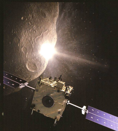
Abb. 3: Orbiter-Sonde «Sancho».

Recht weit gediehen ist die im Jahr 2005 von der europäischen Raumfahrt-agentur ESA vorgestellte Mission «Don Quijote», benannt nach der berühmten Romanfigur von MIGUEL DE CERVANTES. Das Projekt besteht aus den beiden unabhängig von einander gestarteten Sonden «Sancho» und «Hidalgo». Während Sancho das erdnahe Zielobjekt aus einem Orbit heraus beobachtet, soll «Hidalgo» mit ca. 10 km/s auf der Oberfläche des Asteroiden einschlagen und dadurch eine Bahnänderung einleiten. Um diese genau zu quantifizieren, werden vor und nach dem Einschlag Lage, Flugbahn, Rotation, Richtung und Geschwindigkeit des Asteroiden präzise gemessen und verglichen. Ein von Sancho abgesetzter kleiner Lander soll zusätzliche physische Daten aus dem Einschlagkrater liefern. Andere Konzepte, die allerdings bisher nicht über vage Vorschläge hinausgekommen sind, gehen davon aus, dass ein raketentriebenes Vehikel, ein sogenannter Traktor, mit seinem Schub den Asteroiden sanft aus seiner Bahn drückt. Ähnliches sollen riesige, aufblasbare Sonnenspiegel bewirken, die das Sonnenlicht auf eine bestimmte Stelle des Asteroiden fokussieren. Doch auch Ramm- und sogar Bagger-Projekte beflügeln die Fantasien. – Konkret ist dabei wenig bis gar nichts. (mgr)