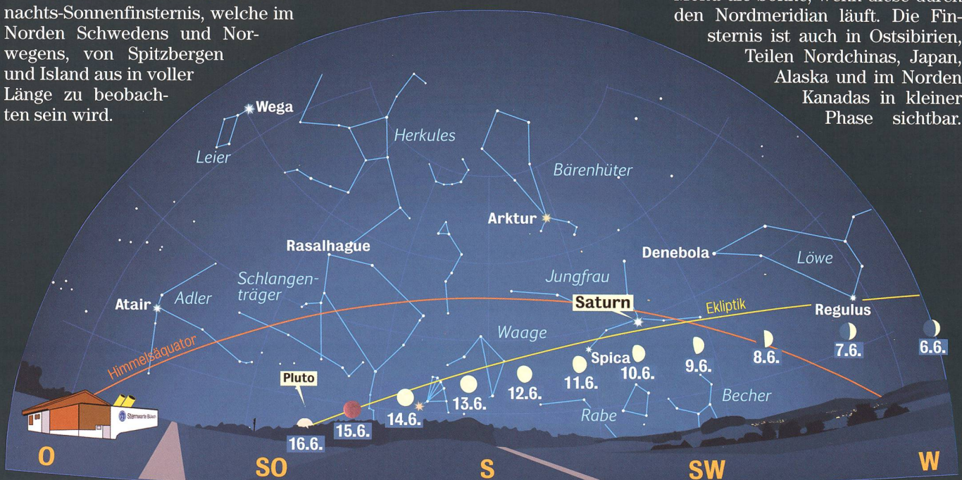
Anblick des abendlichen Sternenhimmels Mitte Juni 2011 gegen 23:00 Uhr MESZ (Standort: Sternwarte Bülach)

diesmal nur etwa zur Hälfte verfinstert, dafür aber um die Stunden der Mitternachtssonne herum. In Island geht das Tagesgestirn nach Ende der Finsternis kurz unter, am Nordkap verdeckt noch ein kleines Stück Mond die Sonne, wenn diese durch den Nordmeridian läuft. Die Finsternis ist auch in Ostsibirien, Teilen Nordchinas, Japan, Alaska und im Norden Kanadas in kleiner Phase sichtbar.