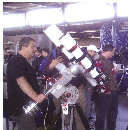
Astronomiefans schlägt an der AME in Villingen-Schwenningen das Herz höher. Oft findet man auch ein günstiges «Schnäppchen».

Um 17 Uhr beginnt dann die 30. VdS-Tagung und Mitgliederversammlung der Vereinigung der Sternfreude e.V.. Einlass mit Sekt-Empfang ist ab 16.30 Uhr in Bad Dürrheim im «Haus des Gastes». Rund um die AME und VdS-Tagung gibt es weitere Veranstaltungen. Ab Dienstag, 6. September startet eine Astronomische Kurzreise zu Sehenswürdigkeiten in Süddeutschland. Am Donnerstag, 8. September und Freitag, 9. September finden jeweils ganztägige Workshops an der Sternwarte Zollern-Alb statt. Am