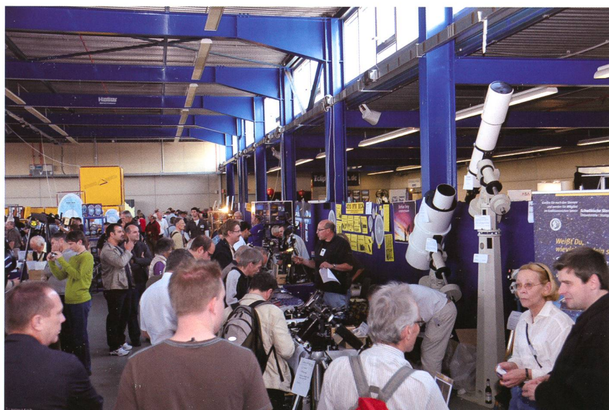
Bereits zum 6. Mal lockt die AME am 10. September 2011 hunderte von Hobby-Astronomen aus dem deutschen Sprachraum an.

Freitagabend sind die Sternwarten Stuttgart und Zollern-Alb für Besichtigungen und Kurzvorträge geöffnet. Ebenso gibt es in Villingen-Schwenningen eine Führung durch die HELLMUT-KIENZLE-Uhrsammlung.