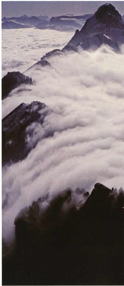
Die Kaltluft, durch Nebel gut sichtbar, fliesst wie ein Wasserfall den Berg hinunter (Standort: Hoher Kasten, Alpstein).

die durch den Menschen verursachte globale Erwärmung. Ebenso werden spektakuläre Licht- und Farbphänomene in der Atmosphäre, wie etwa Regenbogen, Polarlichter, Haloerscheinungen, Fata-Morganas usw. anschaulich dargestellt.