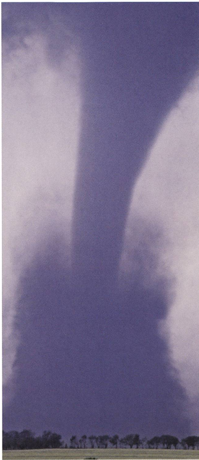
Aus der Basis einer Gewitterwolke südlich von Wichita (Kansas, USA) hat sich ein Tornado gebildet.

die durch den Menschen verursachte globale Erwärmung. Ebenso werden spektakuläre Licht- und Farbphänomene in der Atmosphäre, wie etwa Regenbogen, Polarlichter, Haloerscheinungen, Fata-Morganas usw. anschaulich dargestellt.