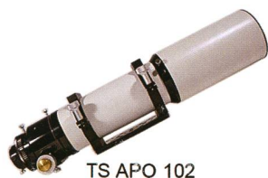
TS APO 102