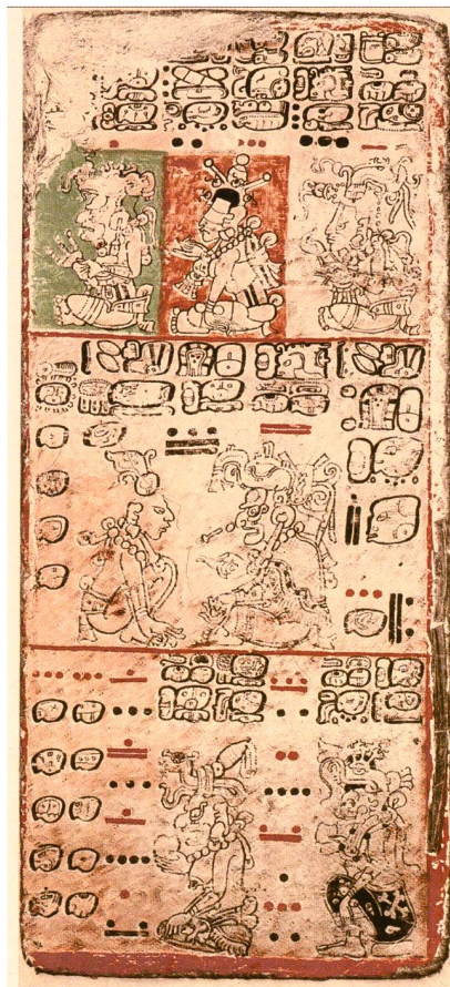
Abbildung 1: Die Maya-Codices sind Bilderhandschriften, in denen Informationen über das Leben der Maya, aber auch über Astronomie und Mathematik aufgezeichnet wurden. Die Maya hatten ein hoch entwickeltes Schriftsystem aus Bildern und Schriftzeichen.

Dezember 2012 tatsächlich ein spezielles Datum erreicht, für uns wohl am ehesten mit dem 31. Dezember