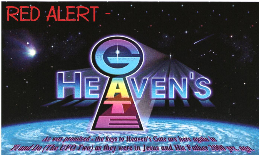
Abbildung 2: Den Massensuizid 1997 im Web angekündigt: Homepage der US-Sekte „Heavens Gate“. 39 Mitglieder dieser Vereinigung brachen auf zu einem angeblichen UFO hinter dem damals prominent sichtbaren Kometen Hale-Bopp.

werk und hatte so nach einem in den letzten Jahren auch für die Fachwelt ziemlich rätselhaften stark verzögerten Anstieg in ihrer Aktivität dann doch im Februar, Juni und auch im August dieses Jahres einige heftige Ausbrüche. Gut möglich, dass im Jahr 2012 weitere Eruptionen folgen, aber es wäre keine Überraschung, wenn sich diese Aktivitäten zurückhielten und erst im Jahr 2013 in Erscheinung treten würden.