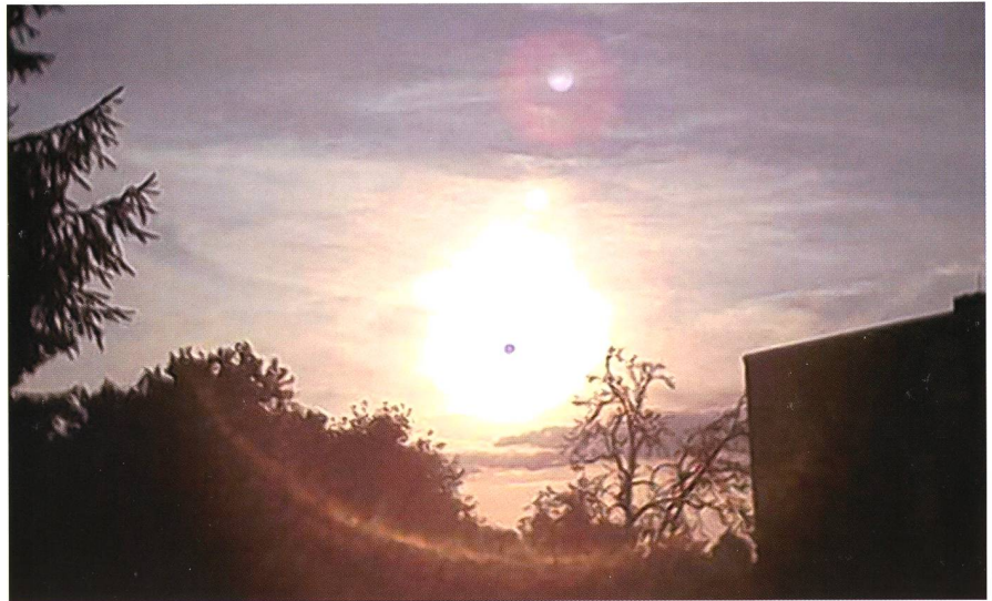
Abbildung 4: Originaltext zu diesem Foto aus einer der vielen 2012-Seiten im Internet: «Oberhalb kann man den Mond sehen, mit einer roten Koma. Ob das schon der Widerschein von Nibiru ist? Denn sein Aussehen ist rot.» – Nein, lieber Nibiru-Freund: Der angebliche Mond und der rötliche Widerschein sind ganz einfach optische Effekte im Kamera-Objektiv und in der Schleier-Bewölkung. Und der dunkle Fleck in der Sonne ist wohl eine Solarisation, hervorgerufen durch die starke Überbelichtung.

Es lässt sich leicht und mit nur ein bisschen elementarer Himmelsmechanik nachweisen, dass ein solcher Körper in einer stark elliptischen und an einen Kometen erinnernde Bahn das Sonnensystem durchqueren und dabei mit seiner Gravitation die vorhandenen Planeten sehr stark stören würde. Viel schlimmer noch: Das Sonnensy-