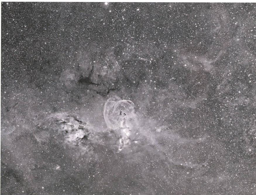
Abbildung 6: NGC 3576 Emissionsnebel im Sternbild Kiel des Schiffs, 10x10 Minuten belichtet mit FLI ML 8300M und Baader H-alpha Filter 7 nm am FSQ-106ED-Refraktor bei f/5.0.

send mit QuickTime mit einer Bildwiederholungsrate von 30 Bildern pro Sekunde zum Film gerechnet. Falls die Zeitrafferaufnahmen vor Sonnenuntergang gestartet oder nach Sonnenaufgang beendet wurden, müssen die Helligkeitsschwankungen während des Dämmerungsverlaufes zum Beispiel mittels einer Deflickering-Funktion herausgerechnet werden. Zum so korrigier-