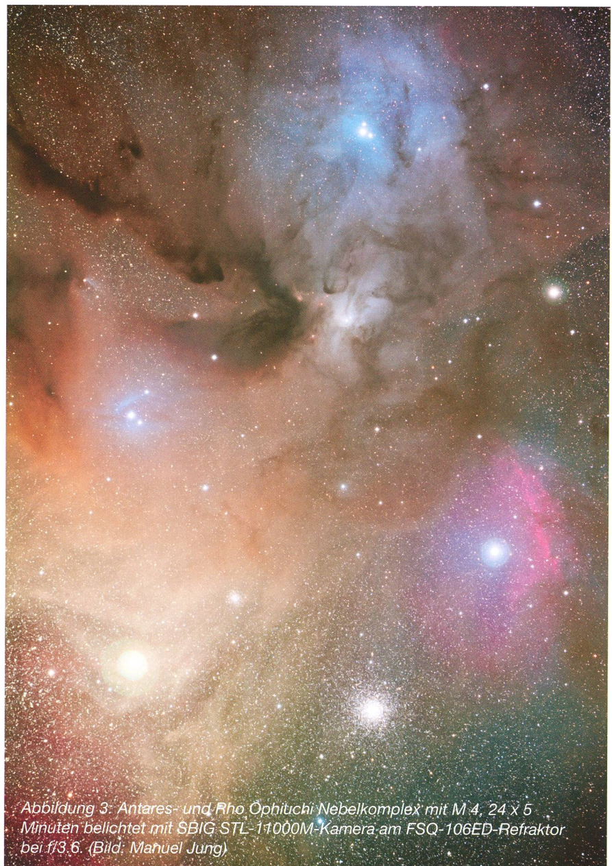
Abbildung 3: Antares- und Rho Ophiuchi Nebelkomplex mit M 4, 24 x 5 Minuten belichtet mit SBIG STL-11000M-Kamera am FSQ-106ED-Refraktor bei f/3.6.