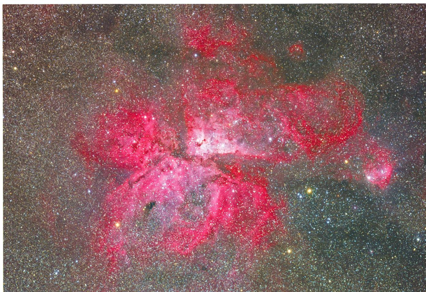
Abbildung 2: Eta Carinae Nebel (NGC 3372), 30x5 Minuten belichtet mit SBIG STL-11000M-Kamera am FSQ-106ED-Refraktor bei f/5.0.

Zur Verdoppelung der Brennweite der beiden FSQ-Refraktoren wurde zudem ein Canon 2x Extender mitgeführt. Bei der Wahl der Fotoobjektive für die Astrofotografie achteten wir auf randscharfes Abbildungsvermögen, hohe Kontrastleistung und gute Farbkorrektur bei noch erträglichem Gewicht, womit schliesslich folgende Linsen mitflogen: Ein Nikkor Weitwinkelzoom 14-24 mm f/2.8G ED, ein Canon Weitwinkelobjektiv EF 35 mm 1:1.4 L, ein Canon EF 50mm f/1.8 II Normalobjektiv sowie zwei Canon EF Teleobjektive: 85mm f/1.8 und 135mm f/2.0 L. Zum gegenseitigen Ausrichten der beiden parallel auf der AP 1200GTO-Montierung installierten Refraktoren wurde zudem eine Einrichtung namens 'Max Guider' der Firma ADM eingesetzt, welche mit der Rohrschelle des einen Refraktors verbunden wird. Dieses eigent-