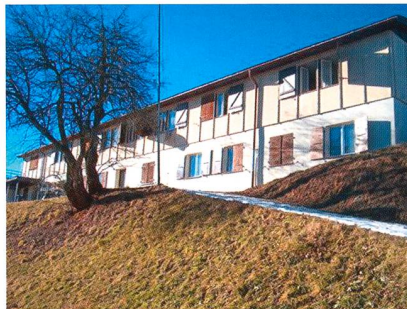
Abbildung 1: Das Ferienhaus Schratzenblick in Marbachegg.

Die neue SAG-Spitze hat die Probleme erkannt und will künftig die Nachwuchsförderung tatkräftig und auch finanziell unterstützen. Das SAG-Jugendlager ist ein erstes Zeichen in eine neue Richtung, nachdem bereits 2011 zwei SAG-Jungmitgliederausflüge erfolgreich organisiert wurden und auf reges Interesse stiessen. Ein solches Lager ist für alle Beteiligten ein unvergessliches Erlebnis. Unter Gleichsinn-