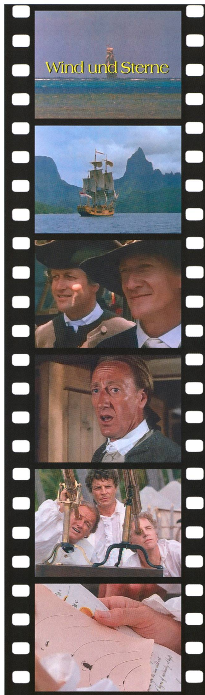
Abbildung 2: Ausschnitte aus der vierteiligen deutsch-australischen TV-Produktion «Wind und Sterne» über die Reisen von James Cook aus dem Jahr 1987 / Die Endeavour vor der Insel Tahiti (in Wirklichkeit Nachbarinsel Moorea) / Naturforscher Daniel Solander und Astronom Charles Green / Astronom Green meldet den Diebstahl des Quadranten / Cook und Solander beim Beobachten des Venusdurchgangs 1769 / Cooks und Greens Skizzen vom Venustransit. Das 4-DVD-Set des Films ist im Handel erhältlich.

Die Resultate von den Mars-Parallaxen des 17. Jahrhunderts bargen demzufolge noch immer eine viel zu grosse Unsicherheit und stellten die Wissenschaft nicht zufrieden. Der Merkurdurchgang durch die Sonne, den HALLEY im Jahr 1677 auf der Südatlantikinsel Saint Helena beobachtet hatte, brachte ihn auf die