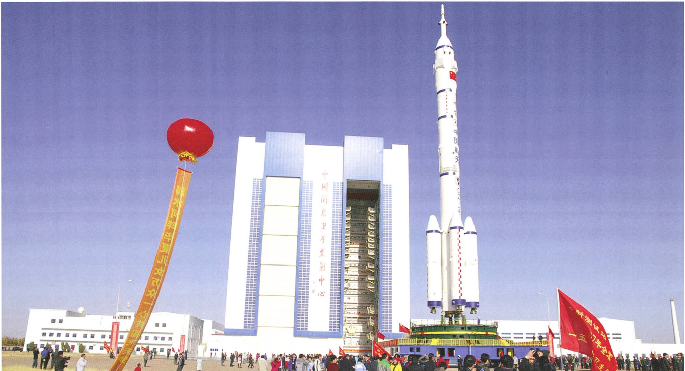
Abbildung 2: Unter grossem Pomp wird jeweils der Roll-out der CZ-2F Trägerrakete auf dem Startkomplex von Jiuquan vorgenommen. Die 62 Meter hohe Trägerrakete wird auf dem Schienenweg zur 1500 Meter entfernten Abschussrampe gerollt.

eine zweistufige Rakete mit einer Höhe von 32,57 Metern und einem Startgewicht von 191 Tonnen. Später wurde diese Rakete als «CZ-2» («Chang Zheng» = Langer Marsch 2) für Satellitentransporte in die niedere Umlaufbahn angeboten. In diese Umlaufbahnen (etwa 300 km) kann sie etwa 1300 Kilogramm transportieren. Eine kleinere Version, die CZ-1, welche aber dreistufig ist, kann auf eine 440 km hohe Kreisbahn 300 Kilo bei einer Bahnneigung von 70° transportieren. Sie wurde 1970 in den Dienst gestellt und transportierte am 24. April 1970 Chinas ersten Satelliten erfolgreich in die Erdumlaufbahn, während die CZ-2 ab dem Jahre 1974 Nutzlasten ins All transportierte.