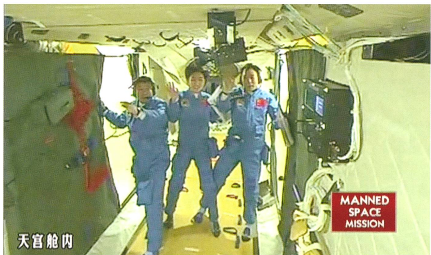
Abbildung 5: Am 18. Juni 2012 betraten die drei chinesischen Taikonauten (darunter eine Frau in Bildmitte) zum ersten Mal die kleine Raumstation Tiangong 1 – ein wichtiger Meilenstein für das bemannte chinesische Weltraumprogramm.

Welche wissenschaftlichen Erkenntnisse die Chinesen sich nun von der bemannten Raumfahrt versprechen, bleibt einstweilen ihr Geheimnis, zumal sie trotz ihrer schnellen Fortschritte noch Jahrzehnte brauchen dürften, um das Niveau der USA und anderer Nationen zu erreichen. Neben der rund 400 Tonnen schweren ISS würde selbst die ausgebaute chinesische Raumstation geradezu winzig wirken. Die politischen Vorteile des bemannten Raumfahrtprogramms lie-