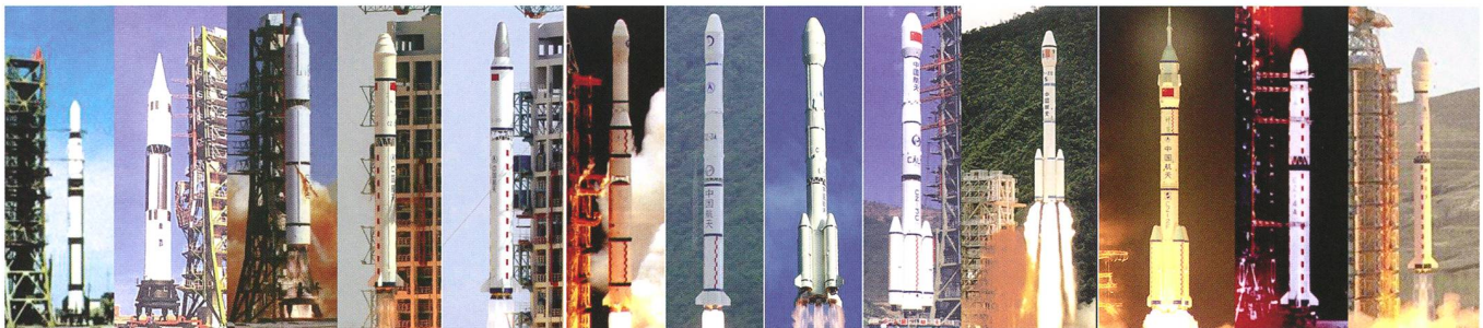
Abbildung 3: Die chinesische Trägerraketenfamilie CZ («Chang Zheng» = Langer Marsch) in Reih und Glied, hier von links nach rechts: CZ-1, FB-1, CZ-2, CZ-2C, CZ-2D, CZ-3, CZ-3A, CZ-3B, CZ-3C, CZ-2E, CZ-2F, CZ-4A, CZ-4B

Trägerrakete. Sie wurde zwischen 1972 und 1981 verwendet. Die Entwicklung der Feng Bao begann im Herbst 1969 beim Büro Nr. 2 für elektromechanische Industrie in Shanghai. Gleichzeitig wurde in Peking an der China Academy of Launch Vehicle Technology (CALT) aber auch an der Rakete Langer Marsch 2 (CZ-2) gearbeitet, die 1974 ihren Erststart hatte, und gegen die sich die FB-1 nicht durchsetzen konnte. Zuständig für die Entwicklung und Koordination des Programms ist die China National Space Administration (CNSA) (mjs)