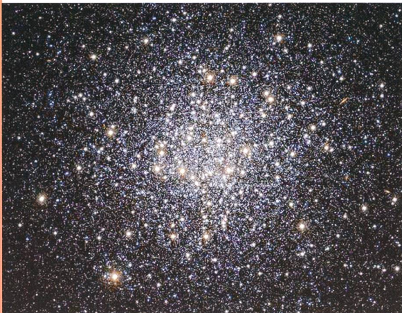
Bild: Messier 55 wurde im infraroten Licht mit dem Visible and Infrared Survey Telescope for Astronomy aufgenommen. Das Teleskop mit 4,1 Metern Spiegel-durchmesser befindet sich am Paranal-Observatorium der ESO im Norden Chiles.

Ein neues Bild des Kugelsternhaufens Messier 55, aufgenommen mit dem 4,1 Meter VISTA-Teleskop der ESO für Infrarot-Himmelsdurchmusterungen, zeigt Zehntausende von Sternen, die sich zu einer Art kosmischem Bienen-schwarm zusammen-geballt haben. Besonders ist an diesen Sternen nicht nur, dass sie in einem ver-gleichsweise kleinen Volumen zusam-mengedrängt sind, sondern auch, dass sie zu den ältesten Sternen im gesamten Universum zählen.