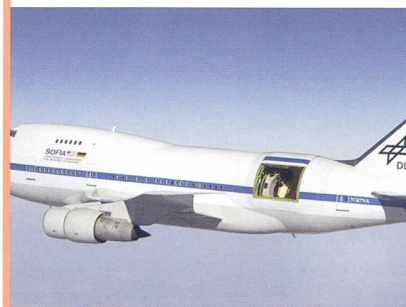
Bild: SOFIA fliegt über Südkalifornien; das in Deutschland gebaute Teleskop mit 2,70 m Öffnung ist zu sehen.

Die erste Serie wissenschaftlicher Beobachtungsflüge mit GREAT an Bord wurde im November 2011 erfolgreich abgeschlossen. Knapp ein halbes Jahr später wurden nun die Ergebnisse in der renommierten europäischen Wissenschaftszeitschrift «Astronomy & Astrophysics» veröffentlicht. Die hohe spektrale Auflösung von GREAT ermöglicht es, durch die Untersuchung der Emission des ionisierten Kohlenstoffs in einer Reihe von Sternentstehungsgebieten das Geschwindigkeitsfeld des Gases in der umgebenden Molekülwolke aufzulösen. In den Hüllen von drei Protosternen gelang GREAT der direkte Nachweis des Kollaps der protostellaren Hüllen, was unmittelbar Rückschlüsse auf die dynamischen Prozesse bei der Entstehung. (aba)