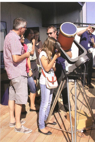
Abbildung 3: Die Sonne lachte am Eröffnungstag mit den Besuchern um die Wette.

Am Sonntag, 9. September 2012, wurde nach dem offiziellen Festakt für geladene Gäste tags zuvor die neue Sternwarte Schaffhausen dem Publikum freigegeben.