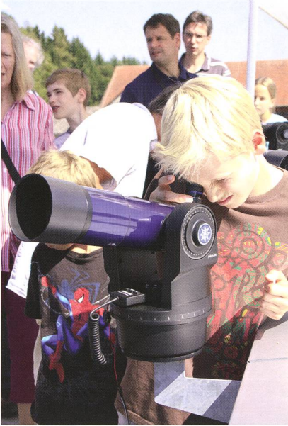
Abbildung 2: Gute Idee; drei ETX-70-Teleskope von MEADE, fix montiert zum selber Bedienen!

preisgünstig und verfügen sogar über eine Goto-Funktion, so dass auch der Laie rasch ein persönliches Erfolgserlebnis hat!