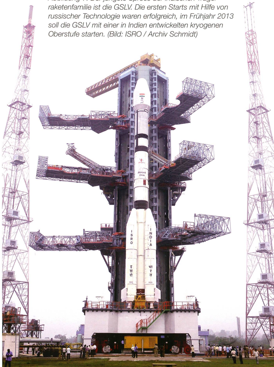
Abbildung 7: Der jüngste Spross der indischen Träger- raketenfamilie ist die GSLV. Die ersten Starts mit Hilfe von russischer Technologie waren erfolgreich, im Frühjahr 2013 soll die GSLV mit einer in Indien entwickelten kryogenen Oberstufe starten.