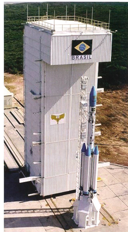
Abbildung 1: Die brasilianische Feststoffrakete VLS-1 auf dem Centro de Lançamento de Alcântara wird für einen Start zum Beginn des neuen Jahres vorbereitet.

Neben den klassischen sogenannten grossen Raumfahrtnationen USA, Russland, China und die Europäische Weltraumorganisation ESA gibt es eine ganze Reihe von Staaten die ein eigenes Weltraumprogramm betreiben und in der Lage sind, aus eigener Kraft Satelliten mit eigenen Trägerraketen ins All zu transportieren. Dazu gehören etwa Israel, Iran, Pakistan und in Kürze auch Südkorea, Nordkorea und Brasilien. Diese Staaten unterhalten ihr Weltraum-Programm aus militärischen Überlegungen und Prestigegründen. Demgegenüber haben sich Indien und Japan zu Raumfahrtnationen entwickelt, welche die unterschiedlichsten Facetten der Weltraumforschung wie kommerzielle Satelliten, Raumsonden, Mond- und Marslandegeräte sowie bemannte Missionen betreiben. Im ersten Teil werden Brasilien als Raumfahrt Schwellenland und Indien, im zweiten Teil (ORION 1/13) Japan als eigenständige Weltraumnationen vorgestellt.