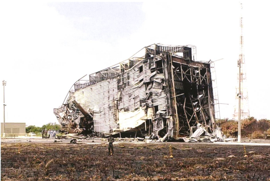
Abbildung 2: Nach der verheerenden Explosion im Jahre 2003 wurde die gesamte Startanlage in Alcântara, darunter der Startturm, völlig zerstört. 21 Techniker starben beim Unglück.

Indien ist heute erst die sechste Raumfahrtsnation, damals das erste Entwicklungsland, welches in der