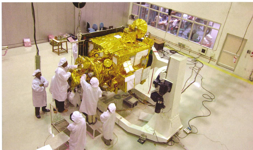
Abbildung 4: Die erste indische Mondsonde Chandrayaan-1 bei der Endmontage. Die Sonde lieferte ab November 2008 über 300 Tage lang Informationen und Bilder des Mondes zur Erde.

Nach derzeitigem Planungsstand soll die nächste GSLV-Rakete im Frühjahr 2013 abheben, um die neue Version zu qualifizieren. Ge-