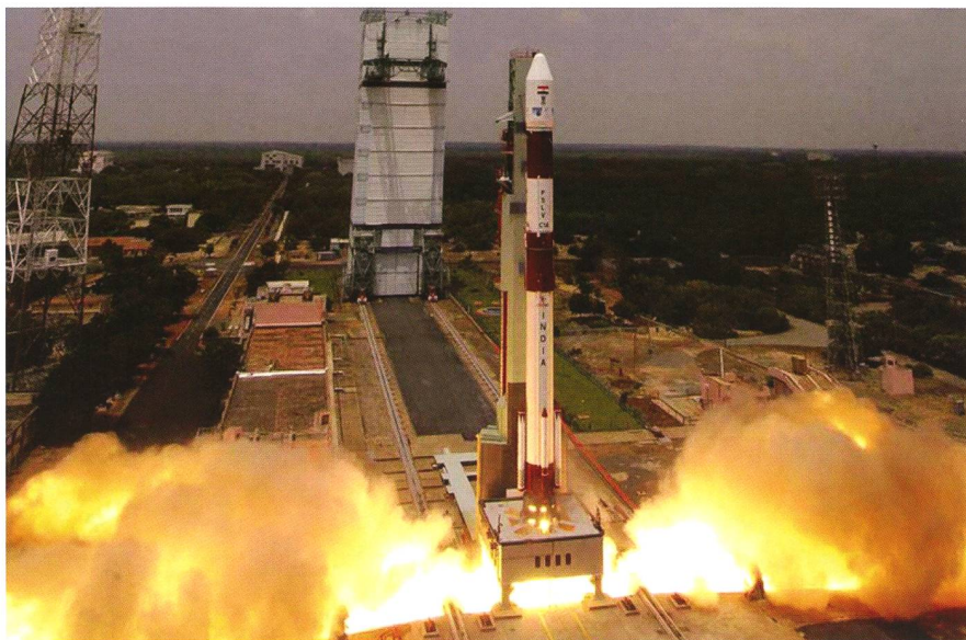
Abbildung 3: Das Rückgrat bei den indischen Trägerraketen bildet gegenwärtig die PSLV. Ab 2013 soll sie von der noch leistungsgesteigerten GSLV abgelöst werden.

Lage ist, eigene Satelliten mit selbst entwickelten und gebauten Raketen zu starten. Die nationale Raumfahrtbehörde heisst Indian Space Research Organisation (ISRO) und wurde 1969 ins Leben gerufen. Sie hat ihren Hauptsitz in Bangalore und das Hauptziel ist die Entwicklung von Raumfahrttechnologie, darunter Satelliten, Trägerraketen, Höhenforschungsraketen sowie unterstützende Bodentechnik. Der eigentliche «Vater des indischen Raumfahrtprogramms» ist VIKRAM SARABHAI. Das Programm geht ursprünglich auf die Abteilung des indischen Atomenergieministeriums (Department of Atomic Energy) hervor, untersteht aber seit 1972 dem Department of Space und ist seit 1975 eine eigenständige Regierungsorganisation. Diese ging aus dem 1962 geschaffenen Indian National Committee for Space Research (INCOSPAR) hervor.