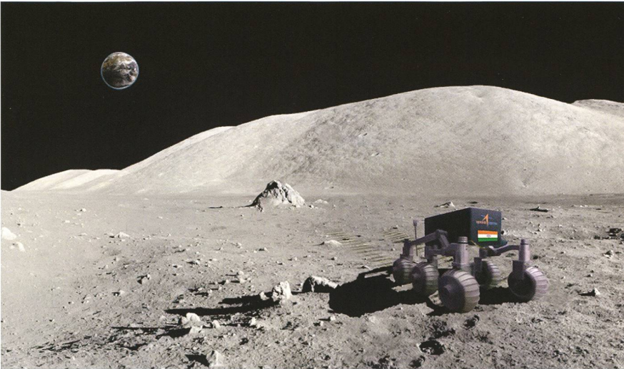
Abbildung 5: Im Jahre 2016 plant die indische Raumfahrtbehörde ISRO den ersten Mondrover mit dem Namen Chandrayaan-2 zum Mond zu starten.

gekommen. Die Vernetzung beider Sonden schlug jedoch fehl. Chandrayaan-1 war zum Messzeitpunkt nicht auf den Mond ausgerichtet. Die Sonde musste aufgegeben werden.