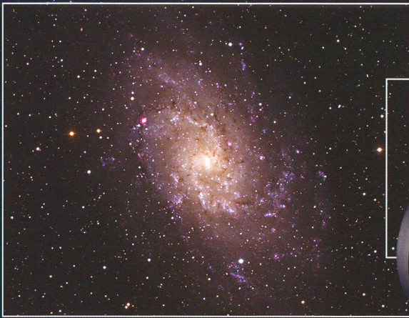
M33 - Spiral Galaxie (Ausschnitt) Aufgenommen mit CGE Pro 1400 HD und Nightscape (abgebildet).