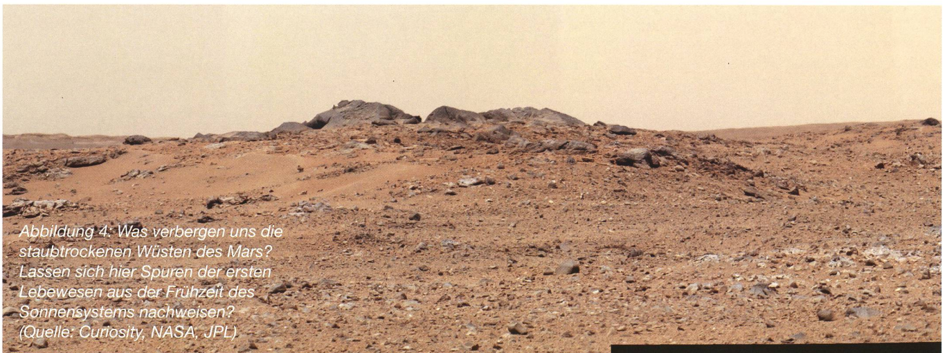
Abbildung 4: Was verbergen uns die staubtrockenen Wüsten des Mars? Lassen sich hier Spuren der ersten Lebewesen aus der Frühzeit des Sonnensystems nachweisen?

Wozu aber könnten Menschen auf den Mars wollen? Ganz sicher brächte eine Kolonie auf dem Nachbarplaneten eine Ausweitung unseres Lebensraumes mit sich, auch wenn wohl für lange Zeit nur wenige von uns dort leben könnten.