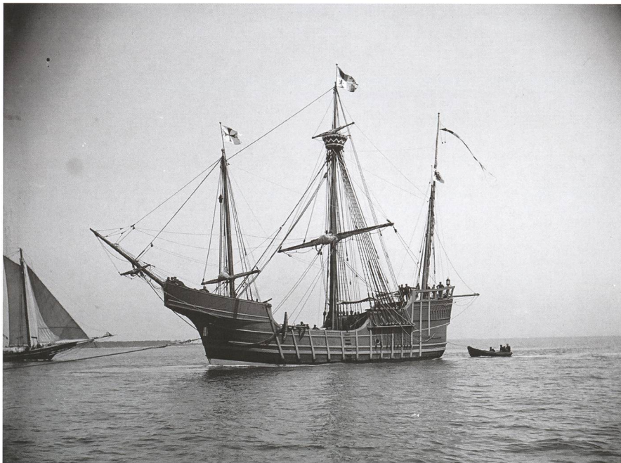
Abbildung 1: Ein Nachbau der Santa Maria aus dem Jahre 1492.

Während die grossen staatlichen Raumfahrtorganisationen im Westen wie im Osten den nächsten logischen Schritt der Menschheit ins All nur sehr zögerlich anpacken, preschen private Investoren vor und wollen schon im nächsten Jahrzehnt einen bemannten Flug zum Roten Planeten erzwingen – für Auswanderer und ohne Rückfahrchein. Wäre ein solches Projekt als sinnvolle Weiterentwicklung der bemannten Raumfahrt zu begrüssen oder ist es nur Ausdruck einer sinnlosen, selbstmörderischen Prestigesucht auf der Suche nach dem ultimativen Nervenkitzel?