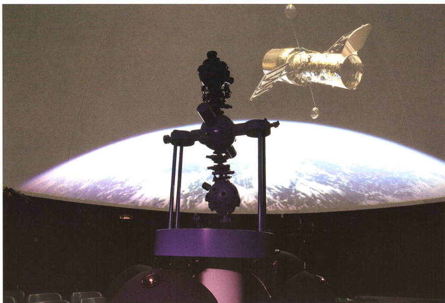
Abbildung 2: Die Fulldome-Projektion mit QUINTO.

scherte dem Sternprojektor ein stattliches Alter. Noch tut er seinen Dienst, projiziert 5'000 Sterne in die 8-Meter-Kuppel und kann immerhin Sonne, Mond und 5 Planeten durch den Himmel fahren lassen. Und das alles in einer optisch beeindruckenden Klarheit.