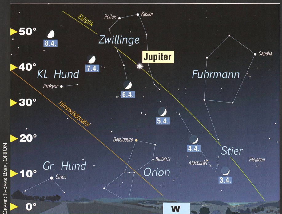
Abbildung 1: Anblick des westlichen Horizonts Anfang April 2014 gegen 23:00 Uhr MESZ.