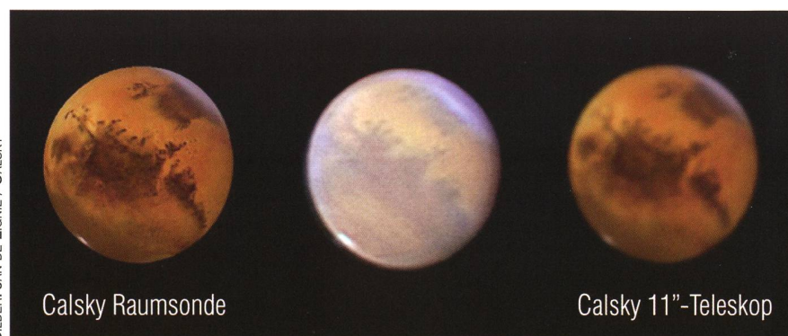
Abbildung 1: Mars am 14. Oktober 2005 gegen 03:35 Uhr MEZ.

Für Planetenbeobachtung sollte die Justierung so genau wie möglich sein. Die Feinjustierung führt man am hellen Stern mindestens bei einer Vergrösserung wie die Öffnung in mm durch (also 250 x für ein 25 cm-Teleskop). Eine gute Hilfe ist um den Scharfpunkt herum zu fokussieren und genau zu beobachten, wie sich die optische Achse bezüglich den konzentrischen Beugungsringen durchs Bild bewegt. Bei hoher Vergrösserung sieht man auch den Angleichungszustand einer Optik bestens und kann unruhige Atmosphäre von Wärmeabgabe der Optik gut unterscheiden; halten Sie jetzt mal eine Hand unter die Eintrittsöffnung des Teleskops. Dann ist man für Beobachtung und Fotografie bereit. Für visuelle Beobachtung tiefstehender Planeten