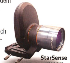
StarSense 919256 Fr. 519.-

Die AVX verfügt neben einem RS232-Anschluss auch über einen Autoguiding-Eingang und zwei AUX-Anschlüsse. Hier können Sie zusätzliche, separat erhältliche Erweiterungsmodule anschliessen – zum Beispiel das SkyQ Link Modul für die Steuerung über WLAN mit iPhone/iPad/Windows-PC oder das StarSense-Modul , mit dem die Montierung ihre Referenzsterne automatisch anfährt und perfekt zentriert.