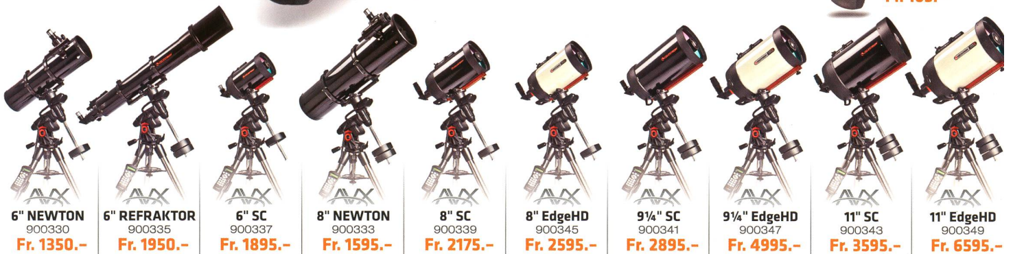
6" NEWTON 900330 Fr. 1350.-