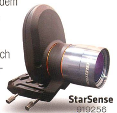
StarSense 919256 Fr. 519.-

Die AVX verfügt neben einem RS232-Anschluss auch über einen Autoguidereingang und zwei AUX-Anschlüsse. Hier können Sie zusätzliche, separat erhältliche Erweiterungsmodule anschliessen – zum Beispiel das SkyQ Link Modul für die Steuerung über WLAN mit iPhone/iPad/Windows-PC oder das StarSense-Modul , mit dem die Montierung ihre Referenzsterne automatisch anfährt und perfekt zentriert.