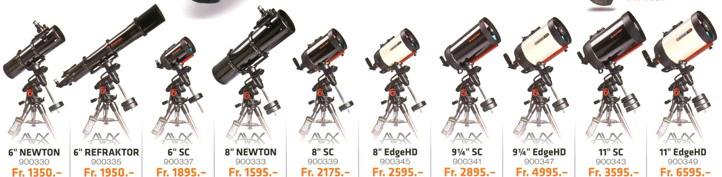
6" NEWTON 900330 Fr. 1350.-