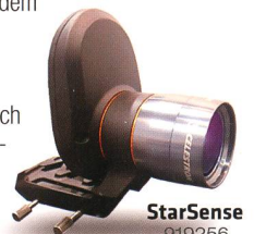
StarSense 919256 Fr. 519.-

Die AVX verfügt neben einem RS232-Anschluss auch über einen Autoguider-Eingang und zwei AUX-Anschlüsse. Hier können Sie zusätzliche, separat erhältliche Erweiterungsmodule anschliessen – zum Beispiel das SkyQ Link Modul für die Steuerung über WLAN mit iPhone/iPad/Windows-PC oder das StarSense-Modul , mit dem die Montierung ihre Referenzsterne automatisch anfährt und perfekt zentriert.