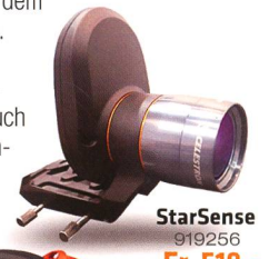
StarSense 919256 Fr. 519.-

Die AVX verfügt neben einem RS232-Anschluss auch über einen Autoguiding-Eingang und zwei AUX-Anschlüsse. Hier können Sie zusätzliche, separat erhältliche Erweiterungsmodule anschliessen – zum Beispiel das SkyQ Link Modul für die Steuerung über WLAN mit iPhone/iPad/Windows-PC oder das StarSense-Modul , mit dem die Montierung ihre Referenzsterne automatisch anfährt und perfekt zentriert.